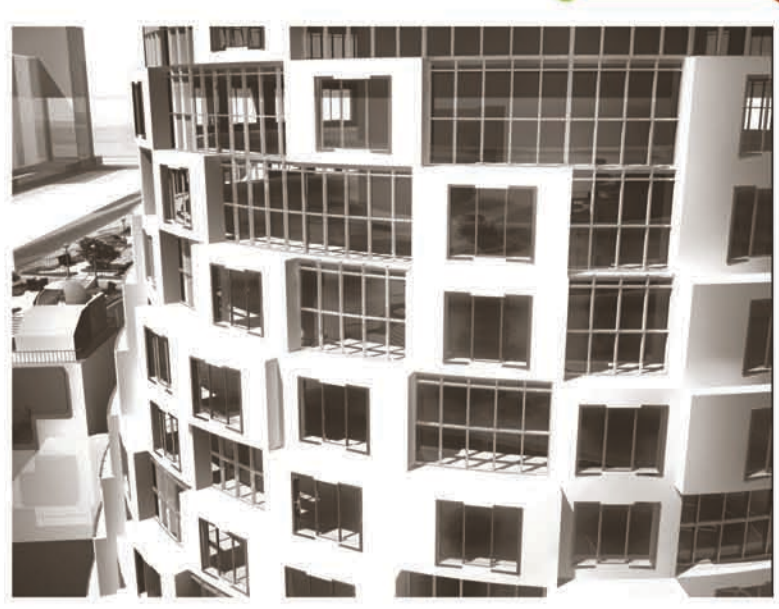
Специализированный жилой комплекс и его функциональное зонирование