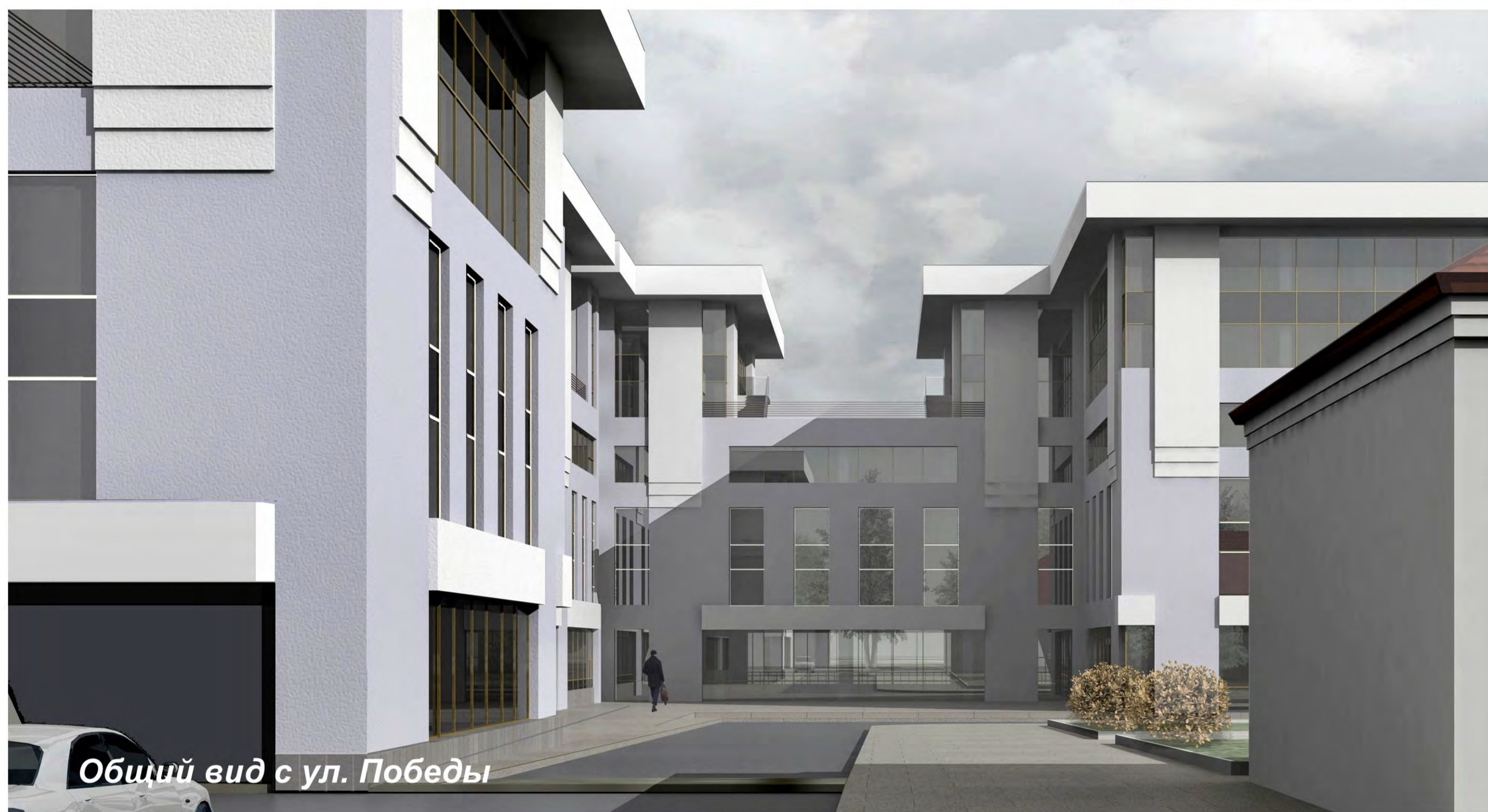
Общий вид с ул. Победы