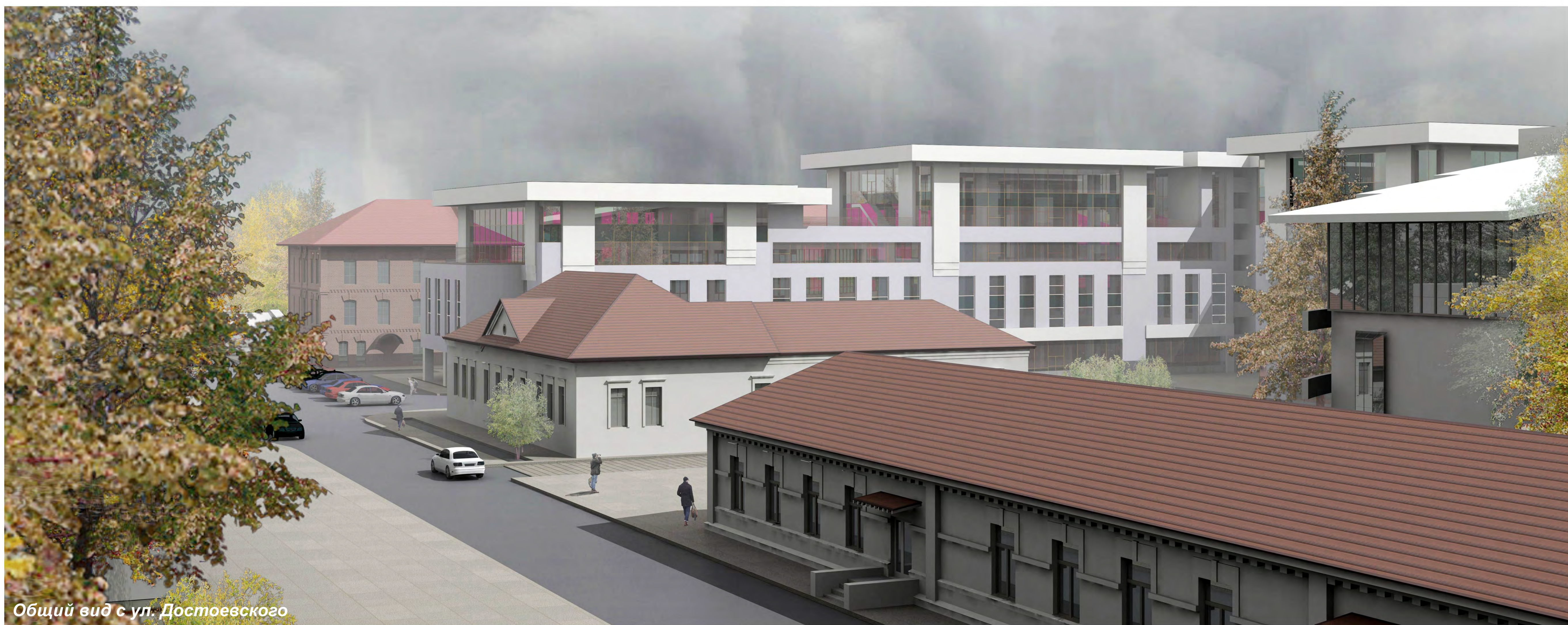
Общий вид с ул. Достоевского