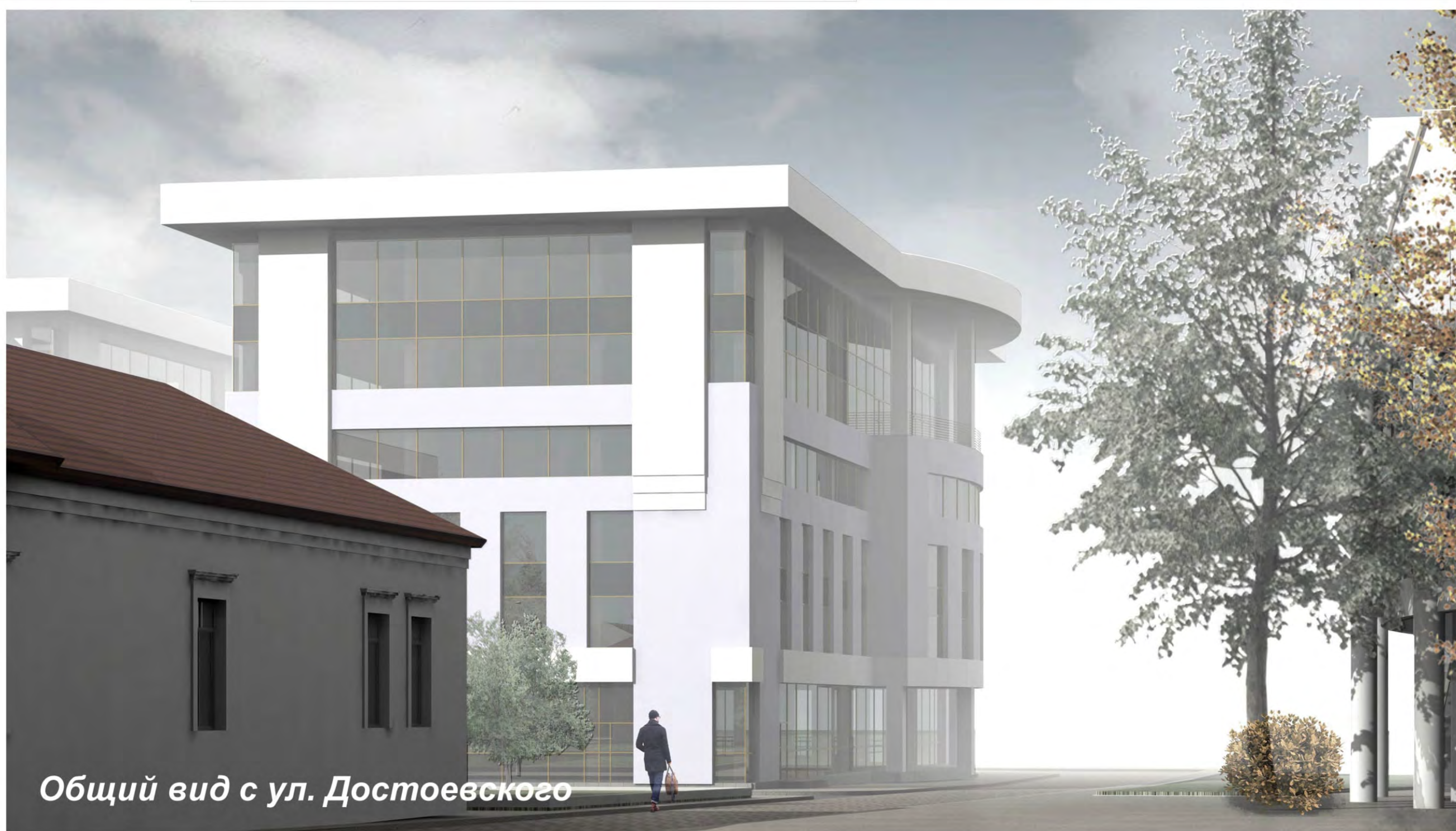
Общий вид с ул. Достоевского