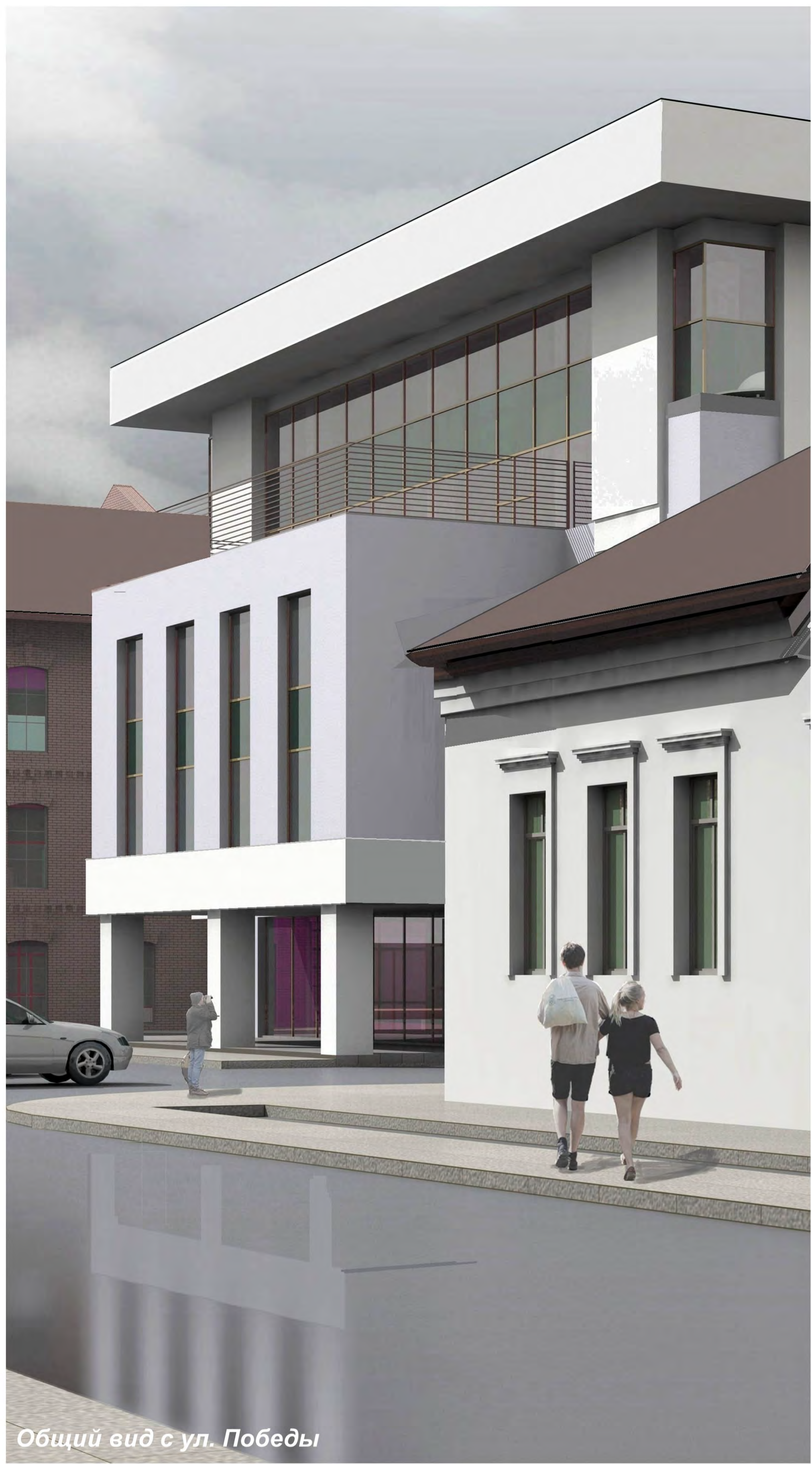
Общий вид с ул. Победы