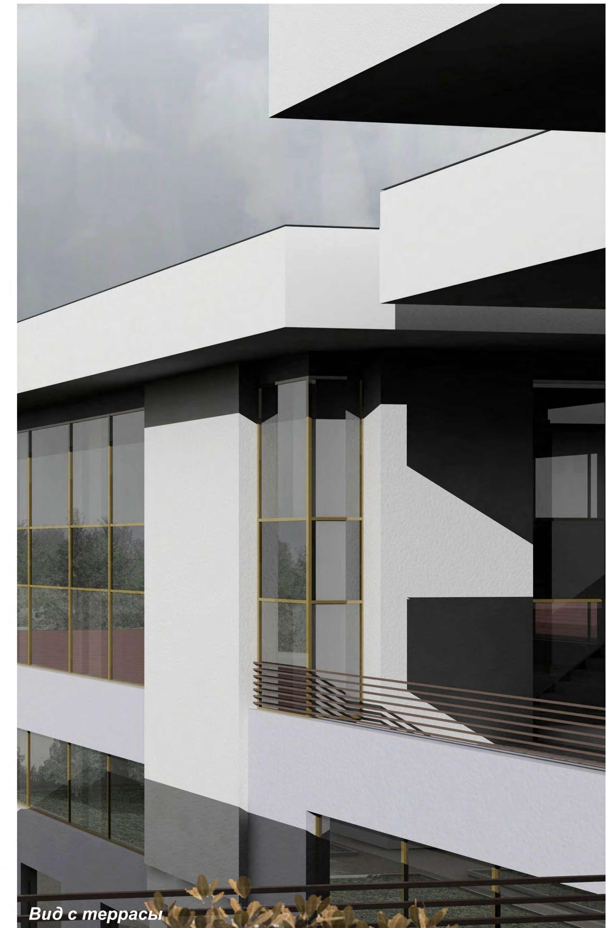
Вид с террасы