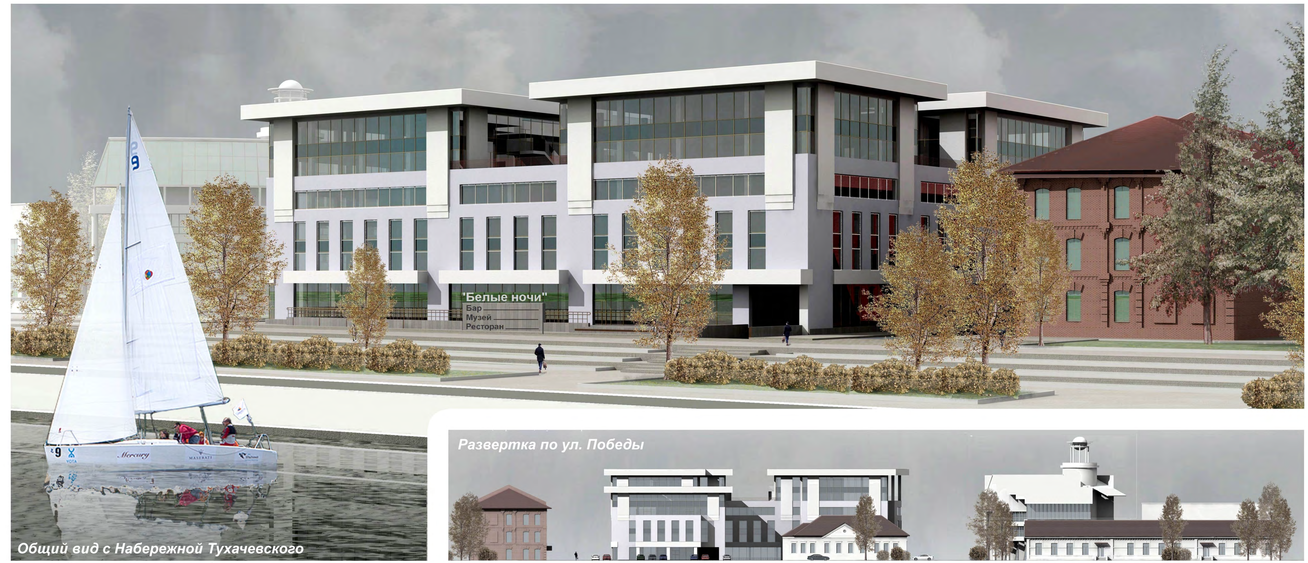
Общий вид с Набережной Тухачевского