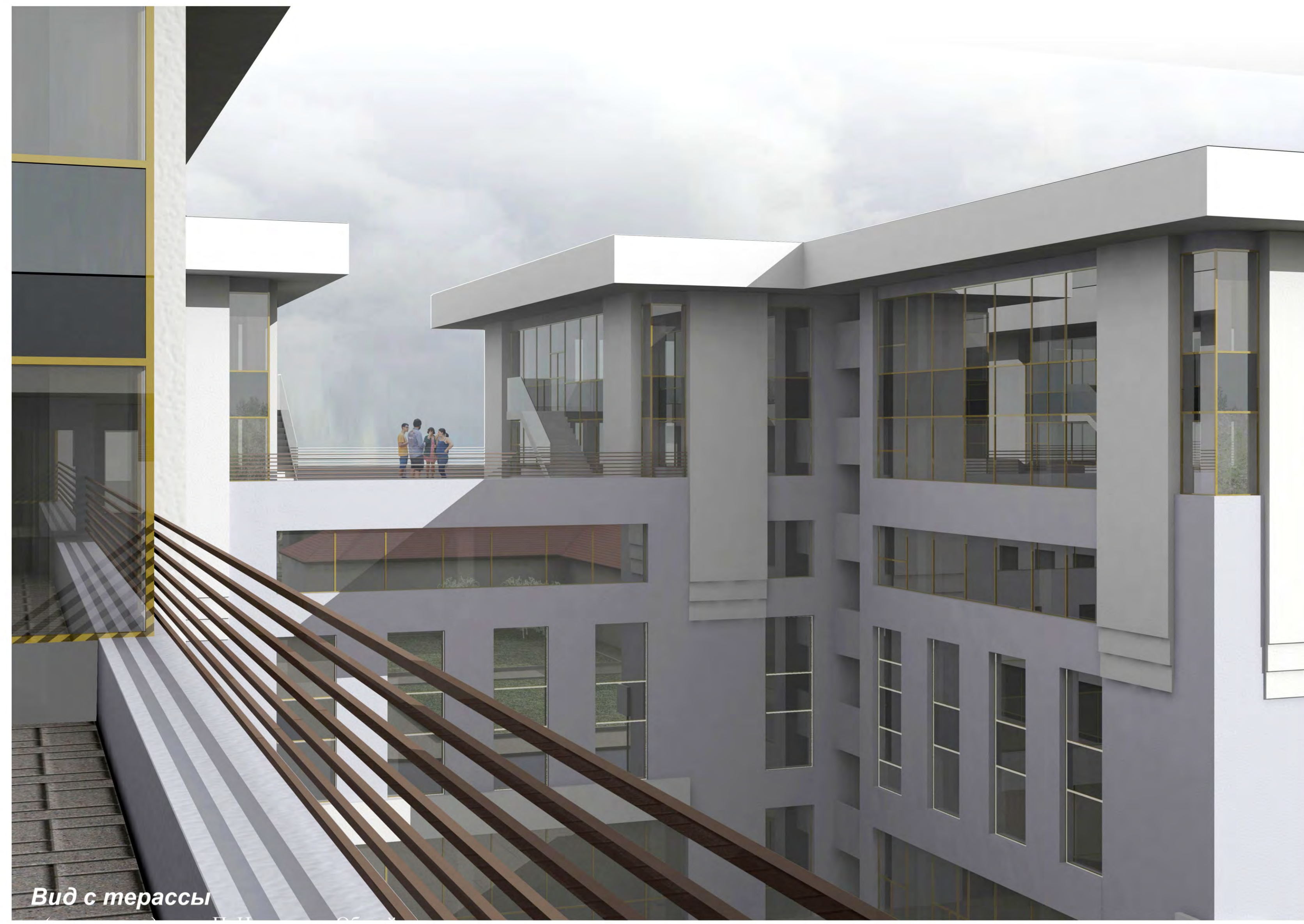
Вид с террасы