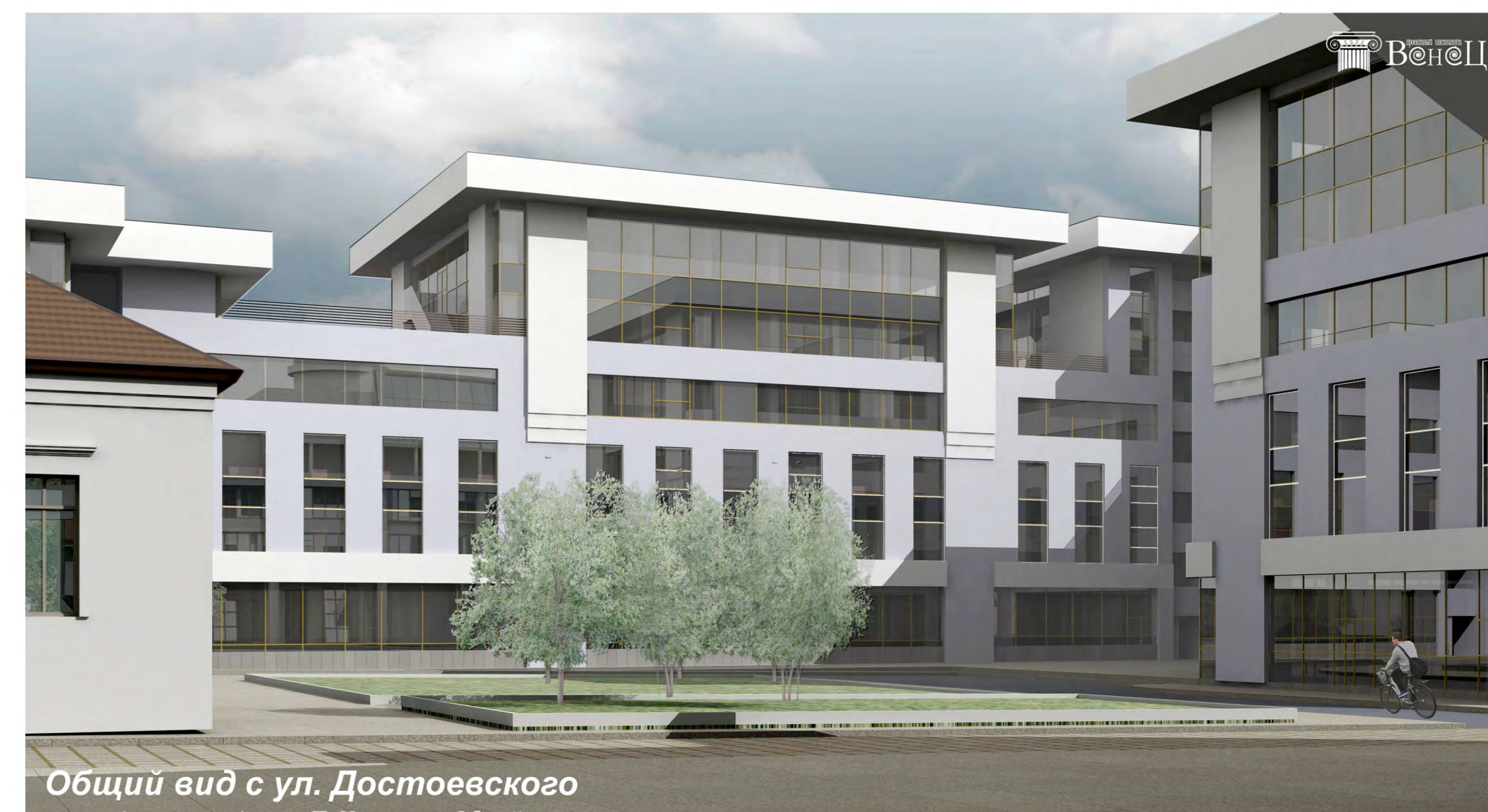
Общий вид с ул. Достоевского