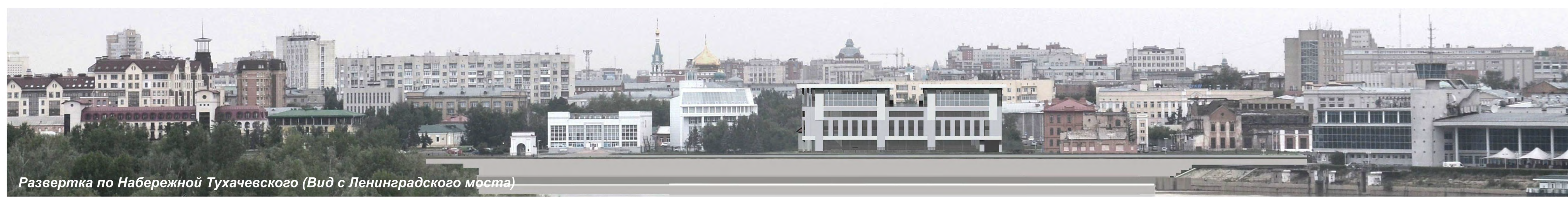
Развертка по Набережной Тухачевского (Вид с Ленинардского моста)