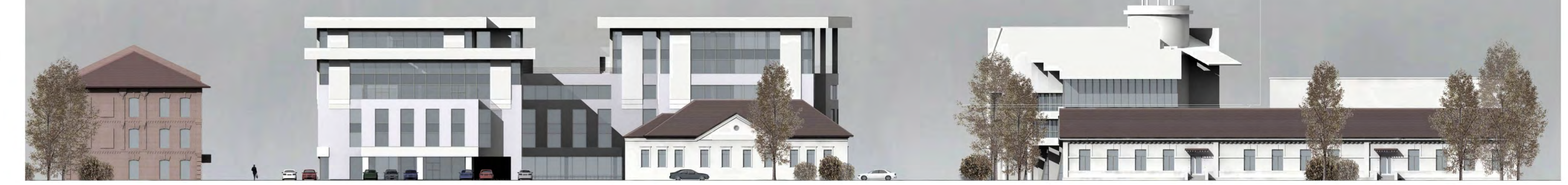
Развертка по ул. Победы