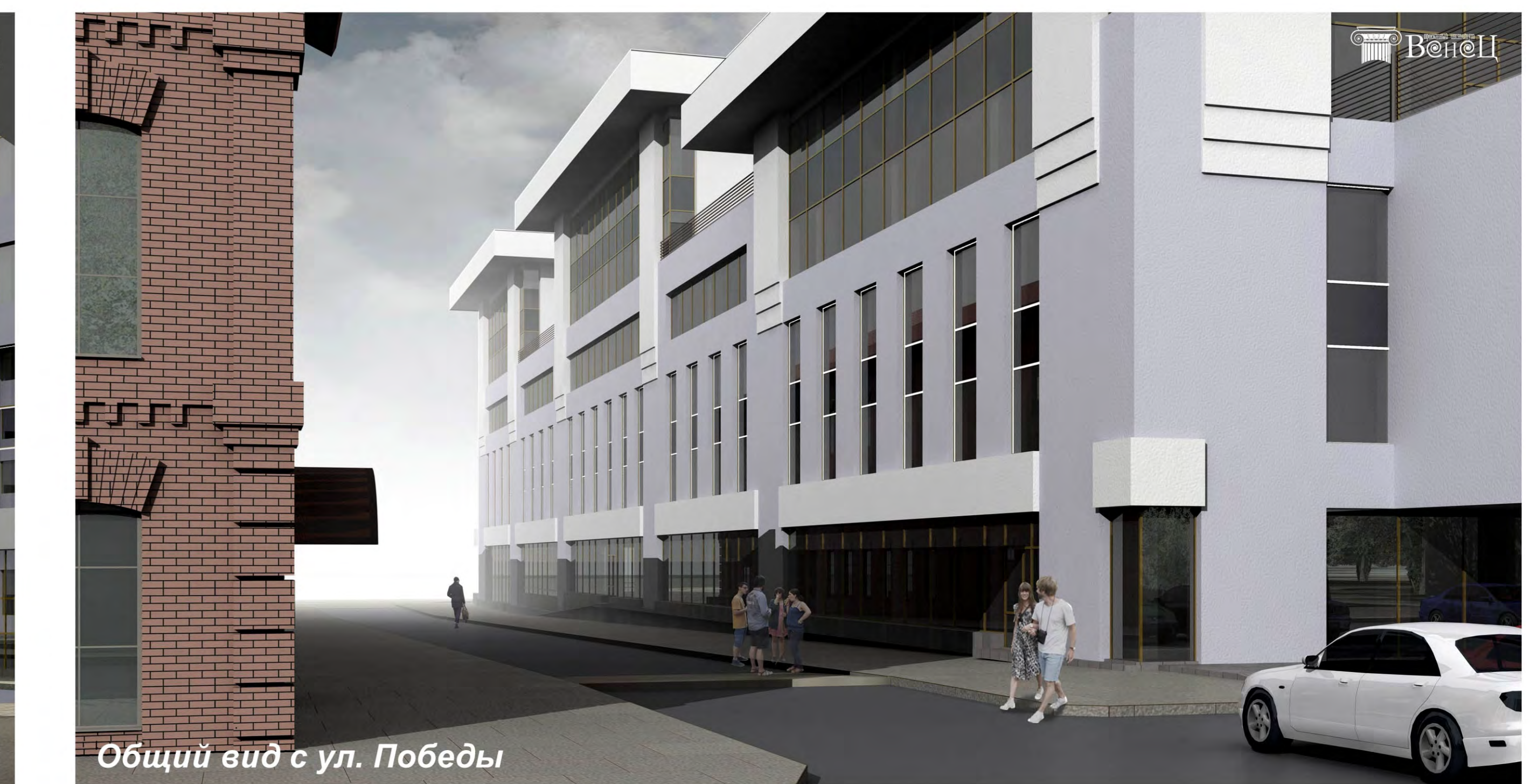
Общий вид с ул. Победы