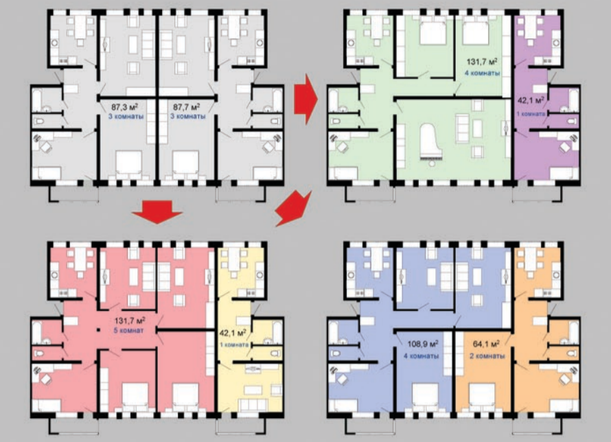
Варианты перепланировки квартиры

Идея формы дома заключается в двух повернутых относительно друг друга квадратах, соединенных в вершине и смещенных по вертикали по рельефу. Угол поворота частей здания продиктован углом между улицей Орджоникидзе и улицей Ленина. Особенностью дома является замкнутый внутренний двор, расположенный над автостоянкой. Сквозные проемы в теле дома открывают обзор города и устраняют ощущение замкнутости. Каждая квартира имеет балкон или оконный проем в наружной стороне дома, что обеспечивает эвакуацию людей при пожаре. Первый этаж здания отведен под торгово-офисные помещения.