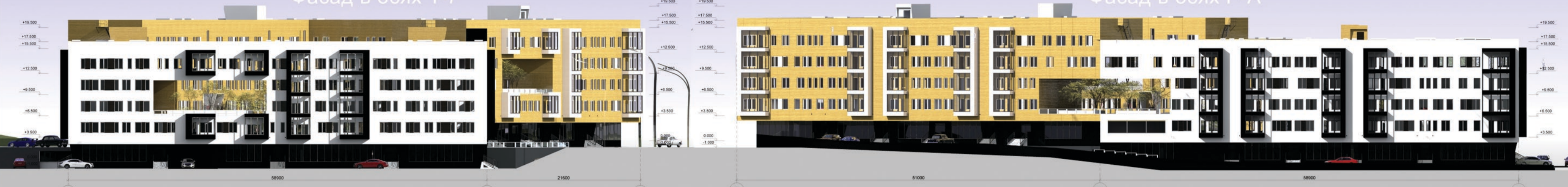
Фасад в осях P-A