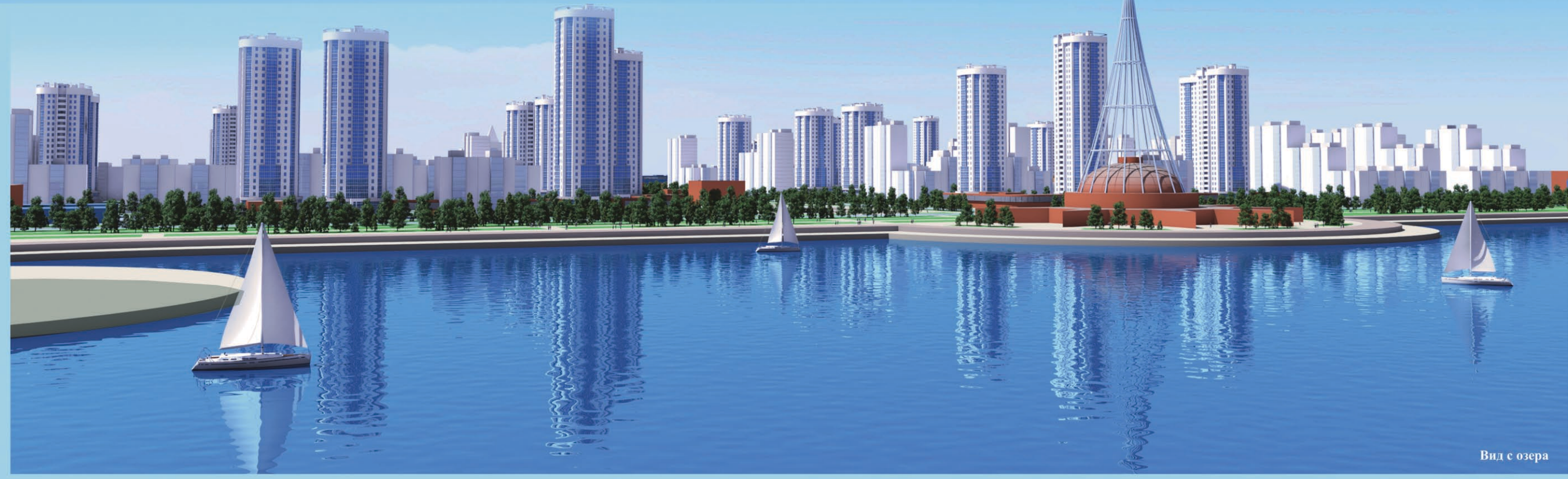
Вид с озера