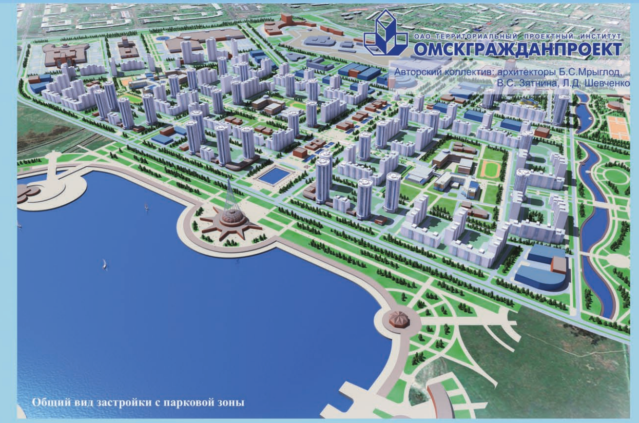
Общий вид застройки с парковой зоной