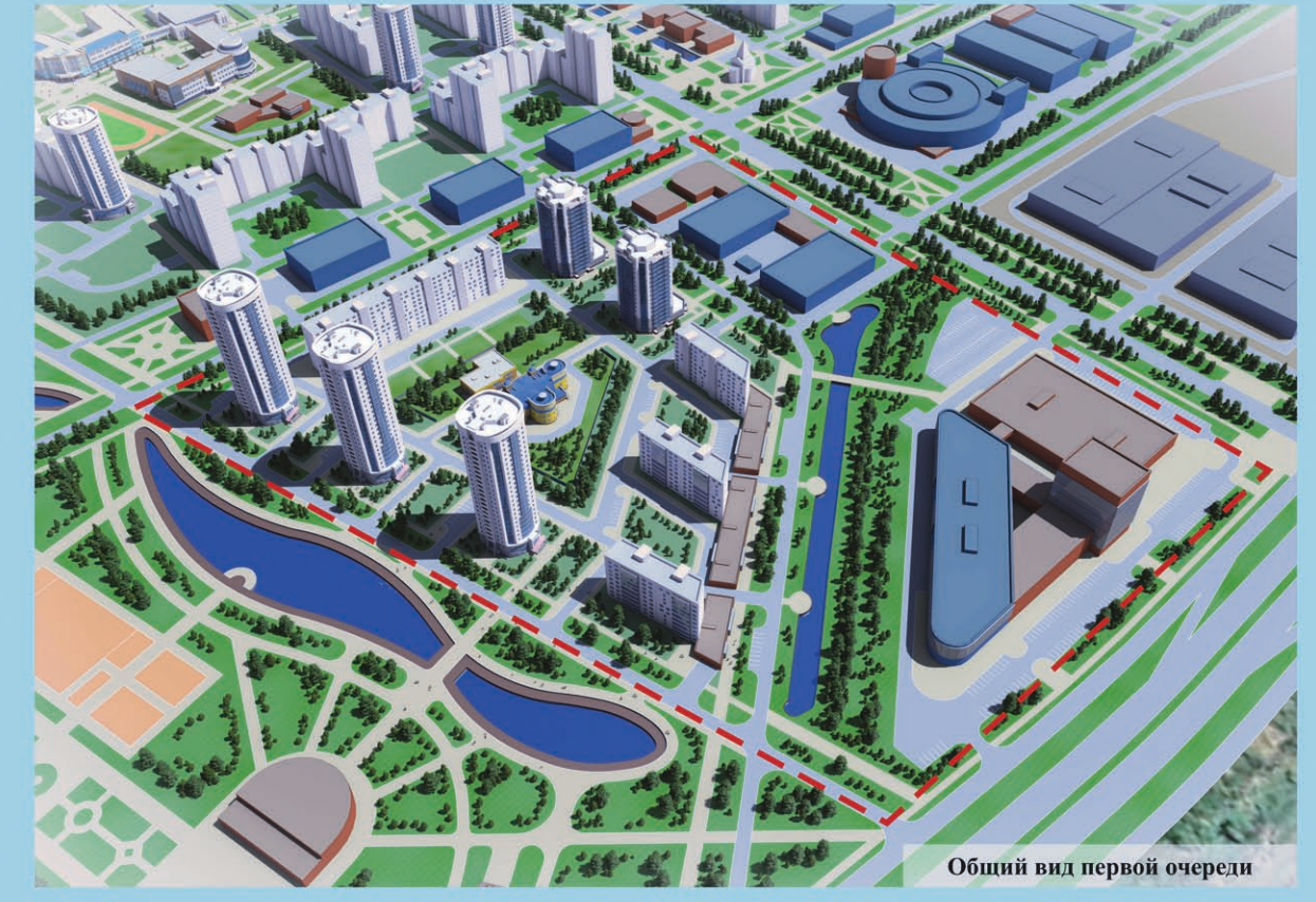
Общий вид первой очереди