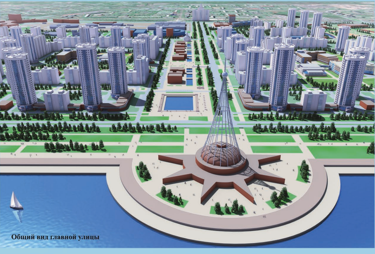
Общий вид главной улицы