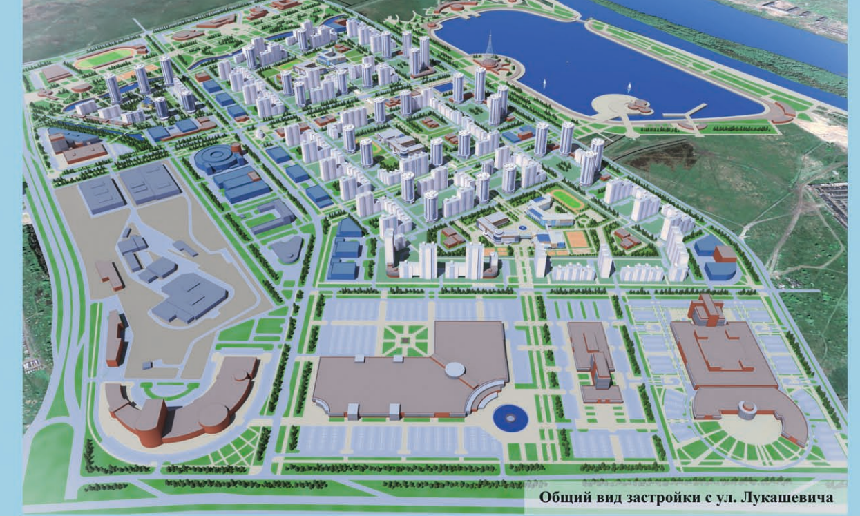
Общий вид застройки с ул. Лукашевича