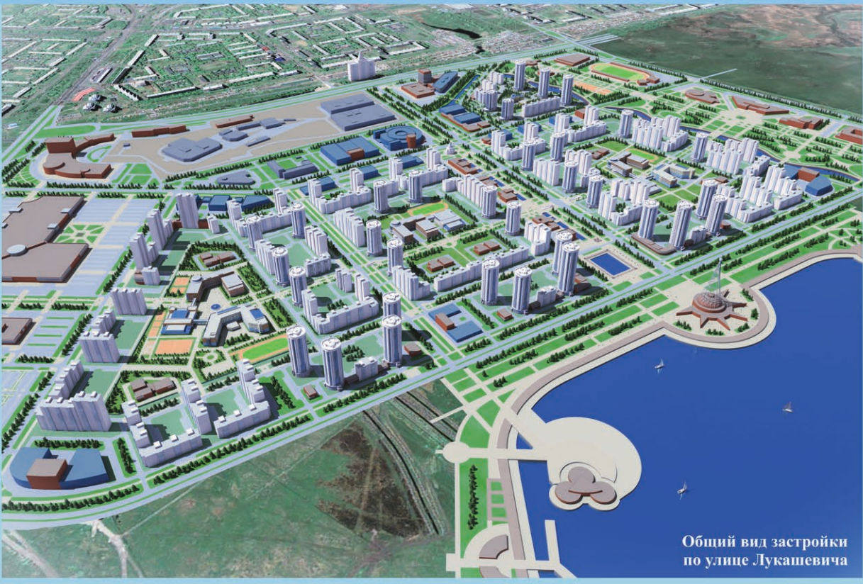
Общий вид застройки по улице Лукашевича

ОАО «ТЕХНОПРОЕКТ» ИРКУТСКИЙ ИНСТИТУТ ОМСКГРАЖДАНПРОЕКТ Авторский коллектив: архитекторы Б.С. Мрыглод, В.С. Затица, П.Д. Шевченко