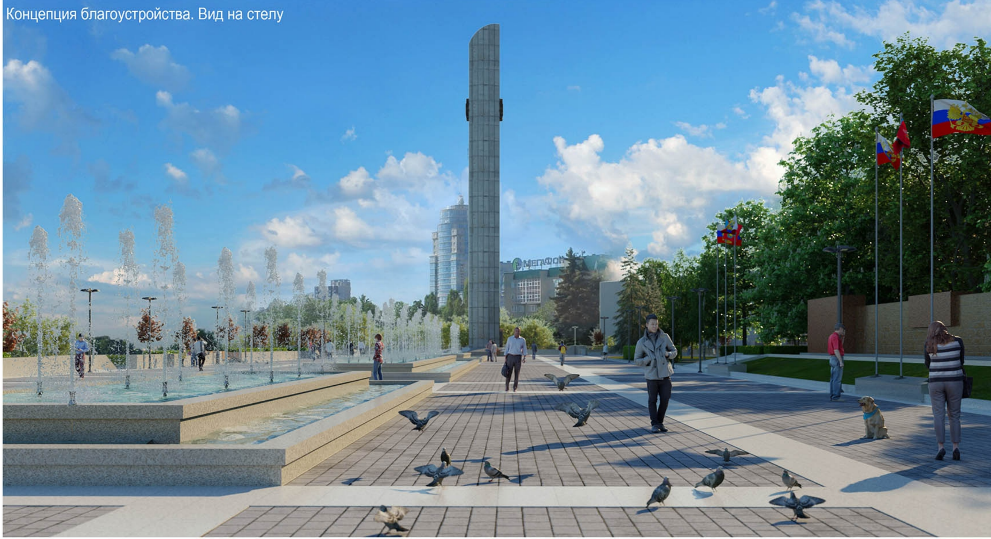
Концепция благоустройства. Вид на стелу