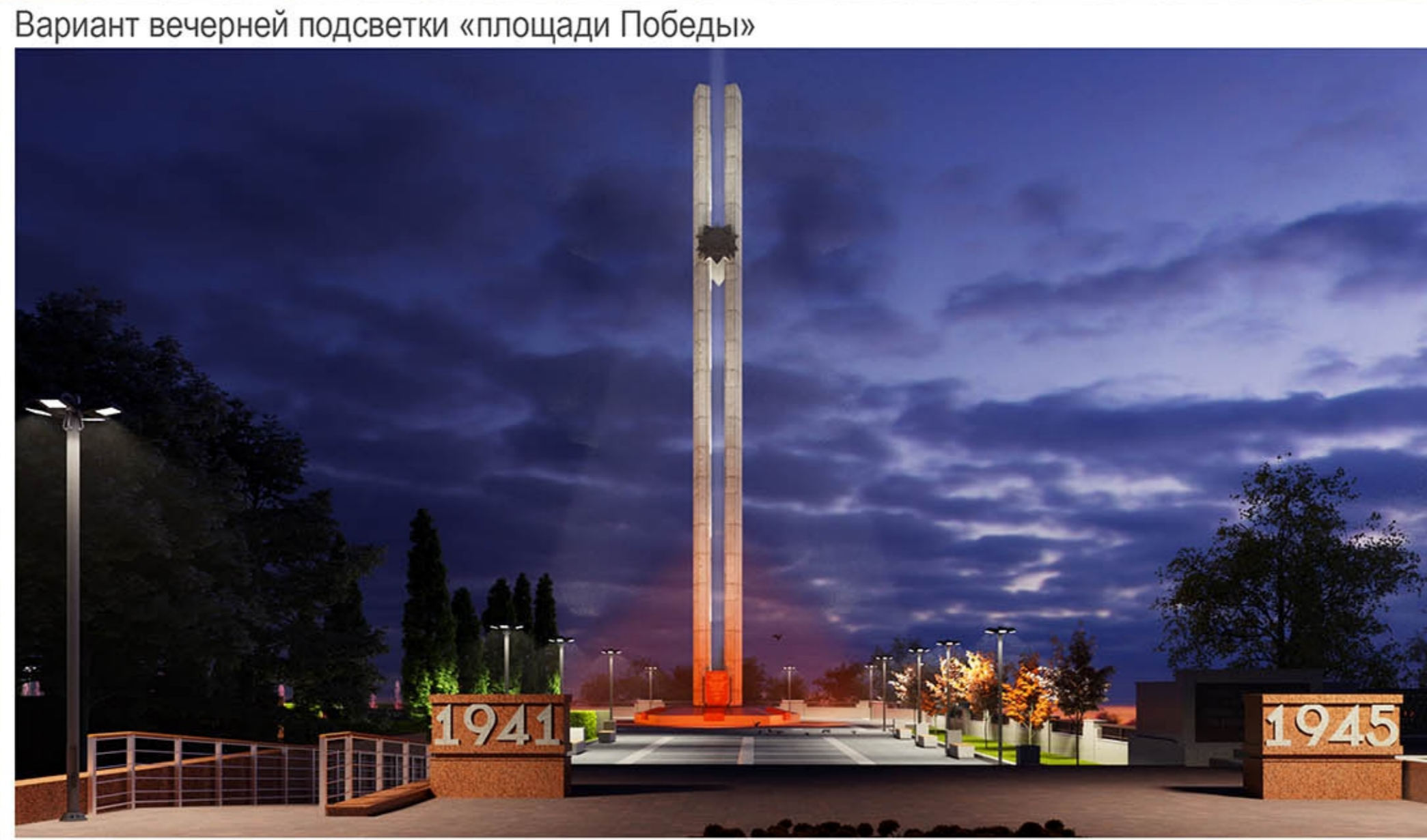
Вариант вечерней подсветки «площади Победы»