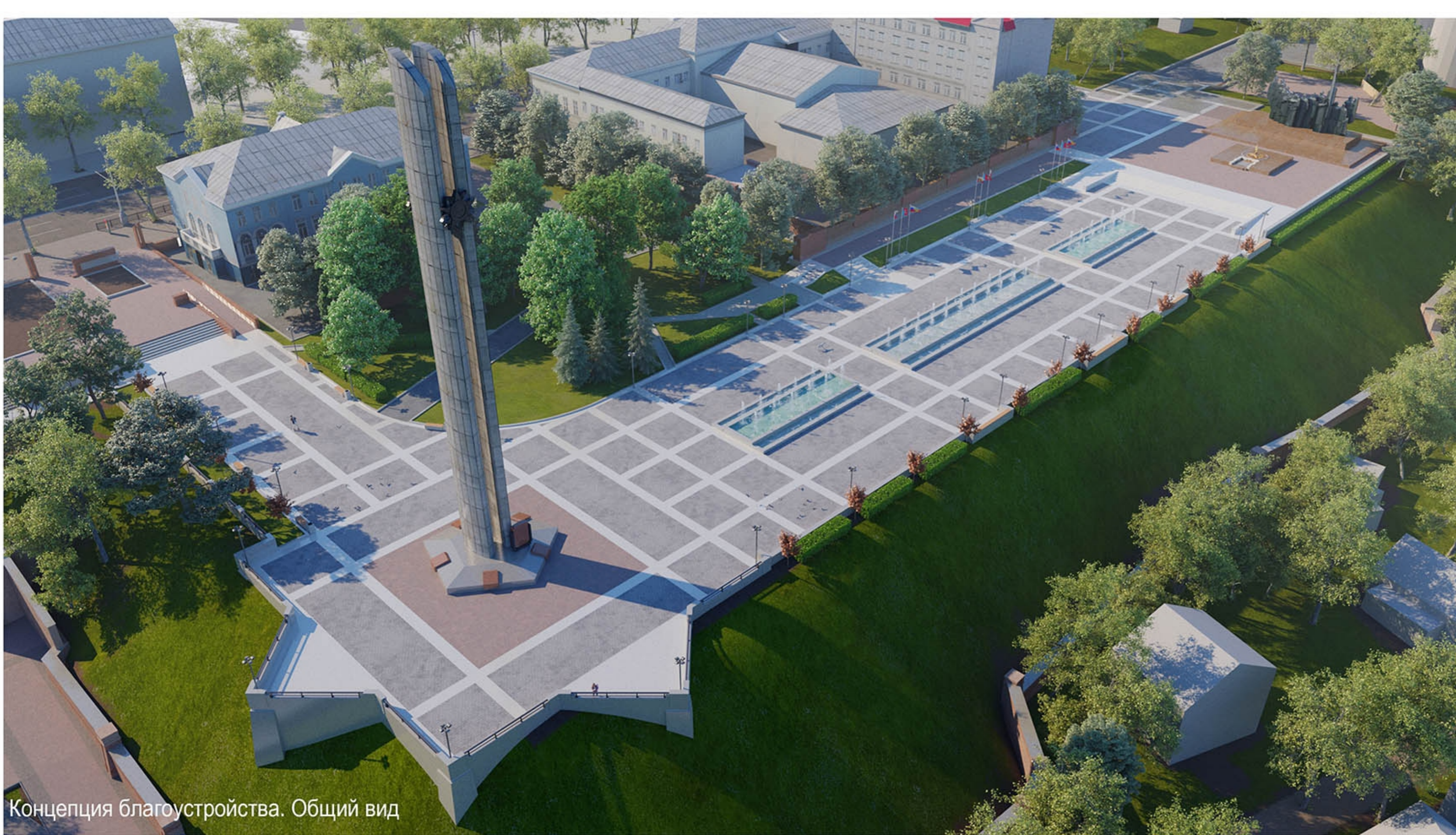
Концепция благоустройства. Общий вид

Кроме этого будет произведена замена освещения, выполнена архитектурная подсветка стелы, скульптурной группы и стены с именами Героев войны. Появятся малые архитектурные формы (скамейки, урны, ограждения склона)