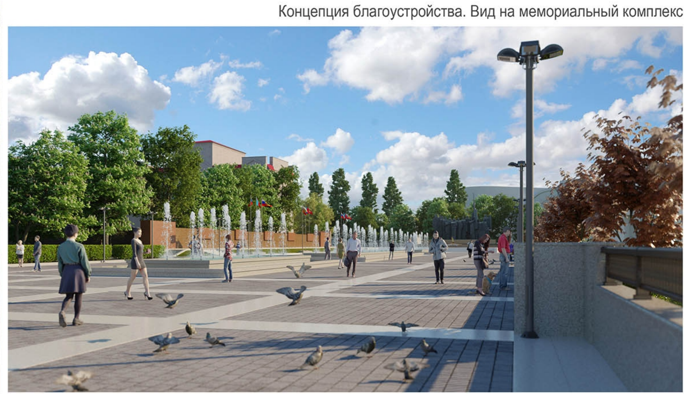
Концепция благоустройства. Вид на мемориальный комплекс