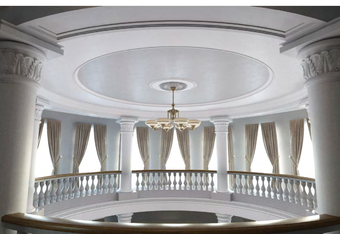
пример визуализации проекта