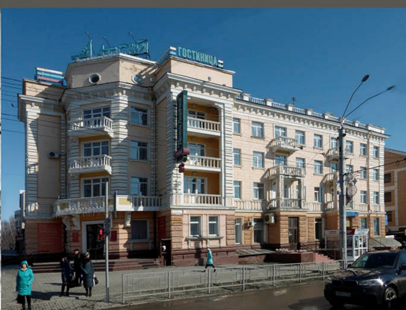
ФОТО МАРТ 2018.