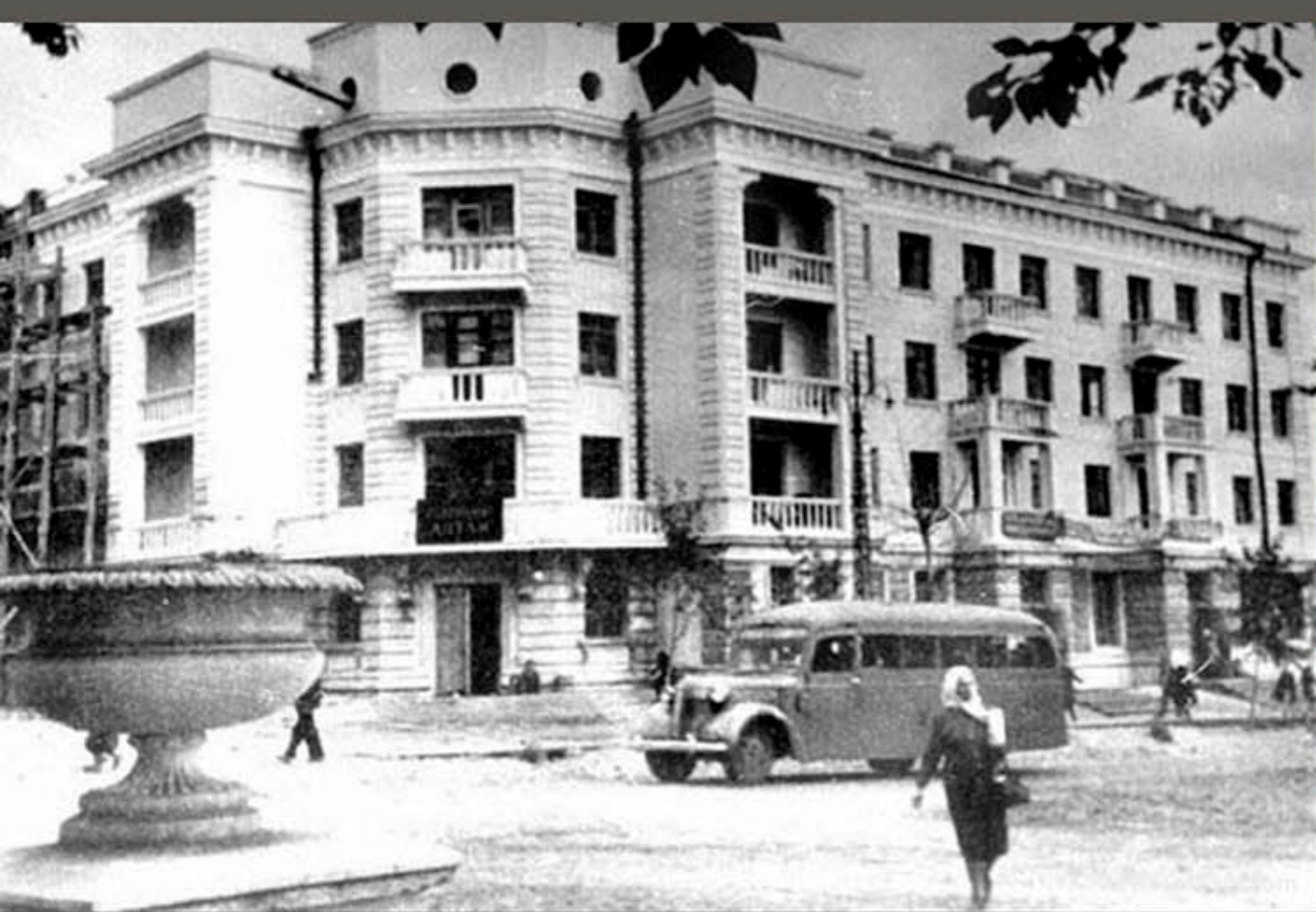
ФОТО КОНЦА 40-Х ГОДОВ 20 ВЕКА.

ПРОЕКТИРОВАНИЕ И АВТОРСКИЙ НАДЗОР - ТВОРЧЕСКАЯ МАСТЕРСКАЯ АРХИТЕКТОРА А.Ф.ДЕРИГА ООО "КЛАССИКА" ДИЗАЙН ИНТЕРЬЕРОВ СОВМЕСТНО С ДИЗАЙНЕРОМ-ДЕКОРАТОРОМ Т.Н.ЩАСТИВЕЦ ОБЩЕСТВОУГОЛОВНЫЕ И РЕСТАВРАЦИОННЫЕ РАБОТЫ ООО "СЭЛФ" 2018-2019 ГОД