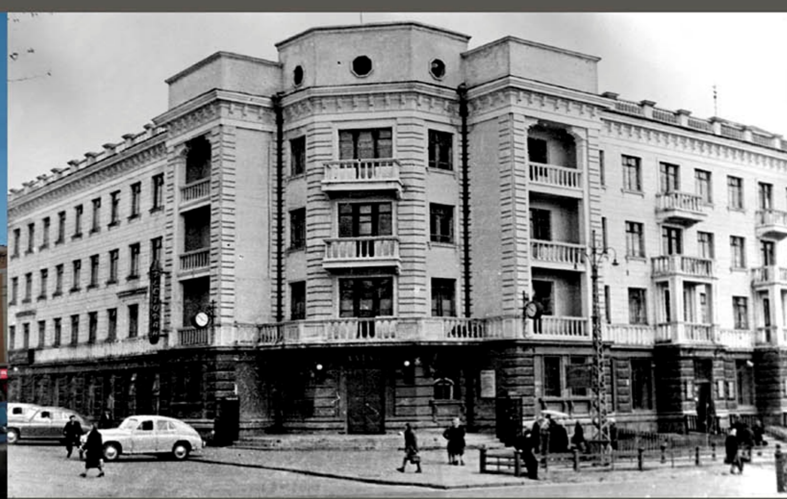
ФОТО КОНЦА 50-Х ГОДОВ 20 ВЕКА.