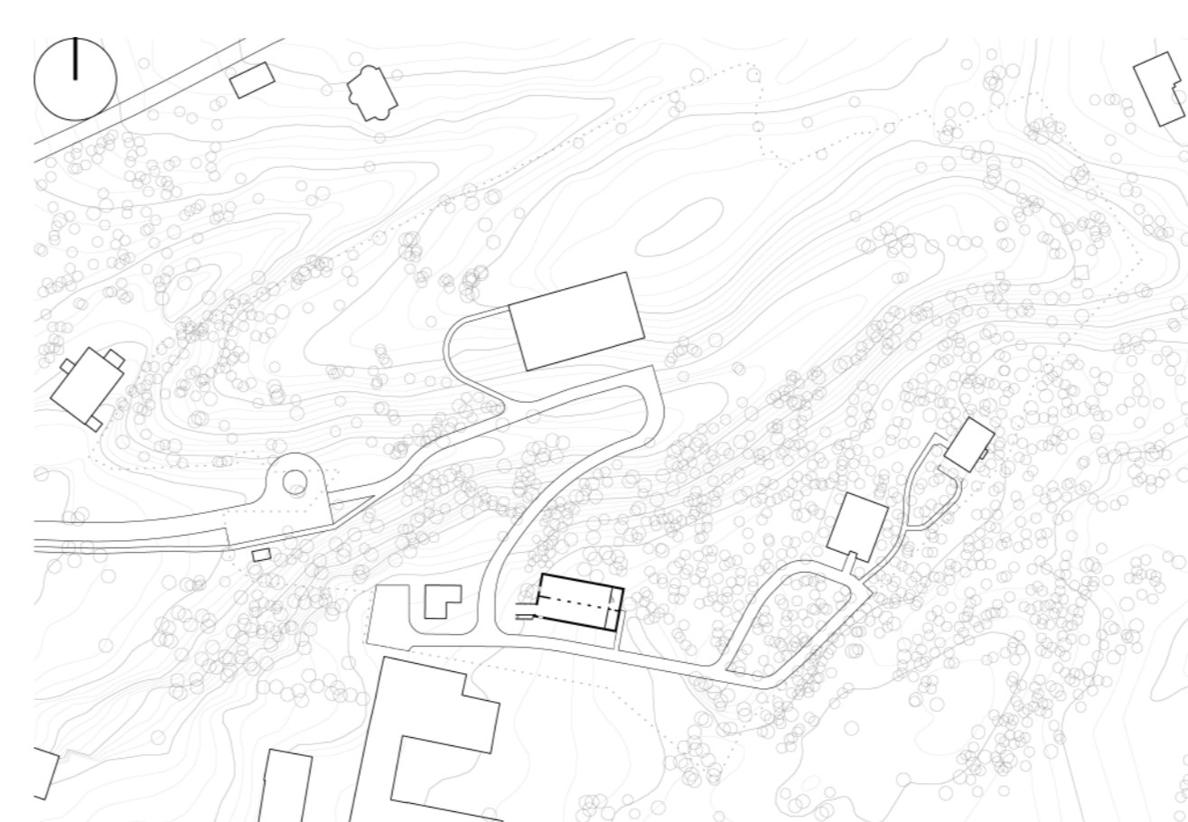
Генплан совмещённый с планом этажа

В полуподземном корпусе №2 планируется разместить пункт проката спортивного инвентаря. Летом кровлю предполагается использовать для проведения праздников. Навесы лестниц возвышаются над застройкой как элемент навигации на территории базы отдыха.