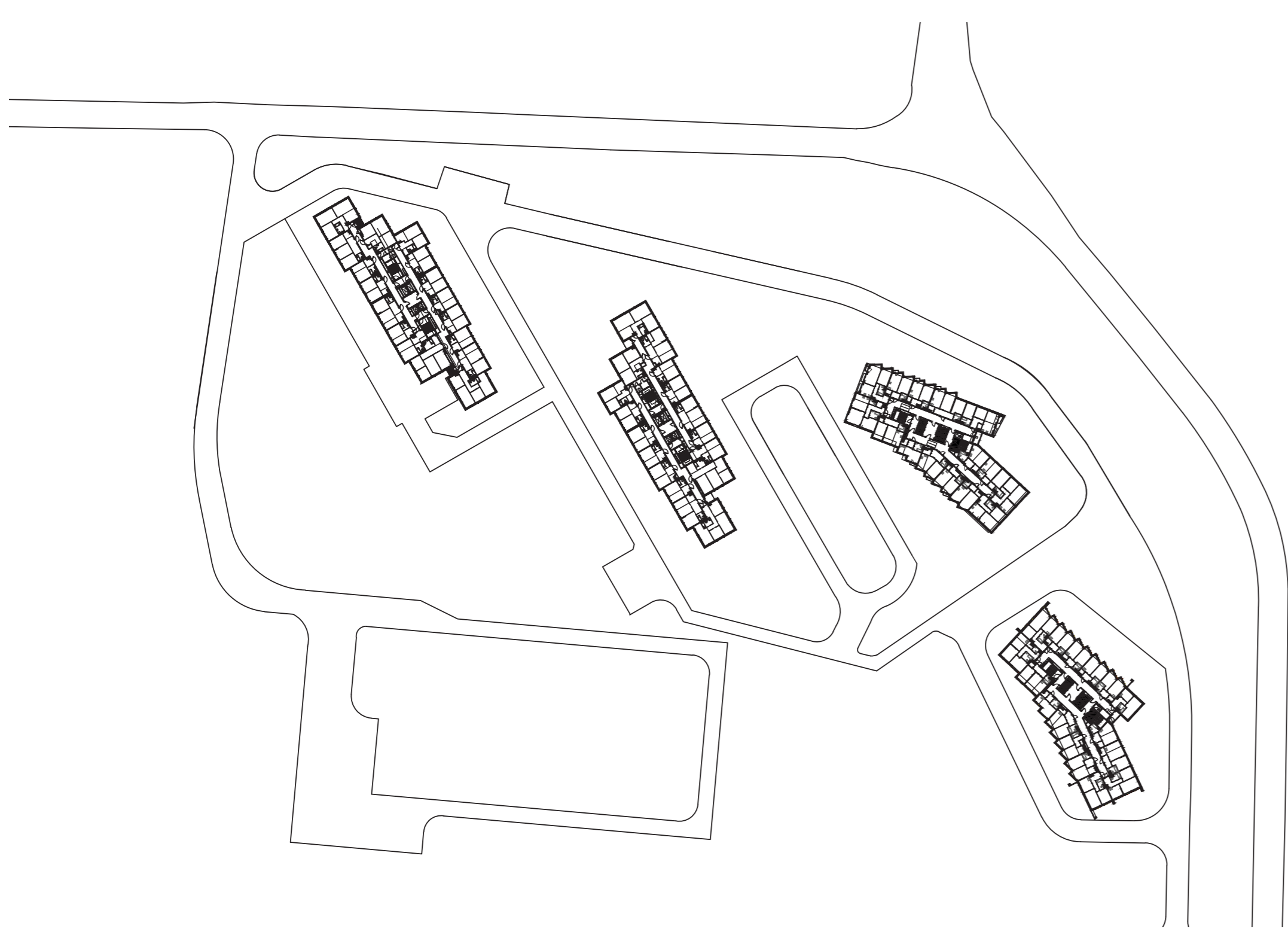
Планы типовых этажей корпусов 5-8 М 1:1000