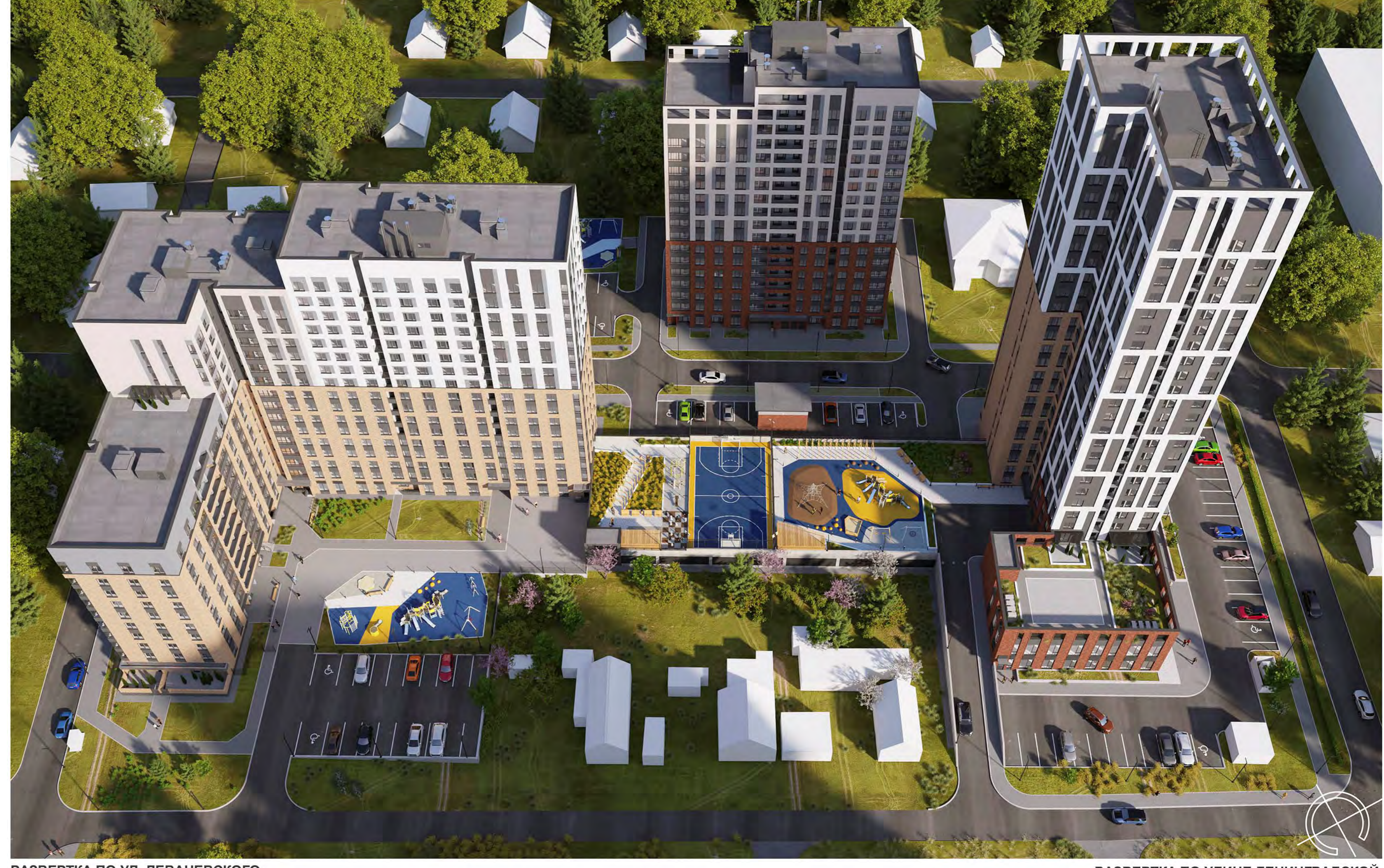
РАЗВЕРТКА ПО УЛ. ЛЕВАНЕВСКОГО