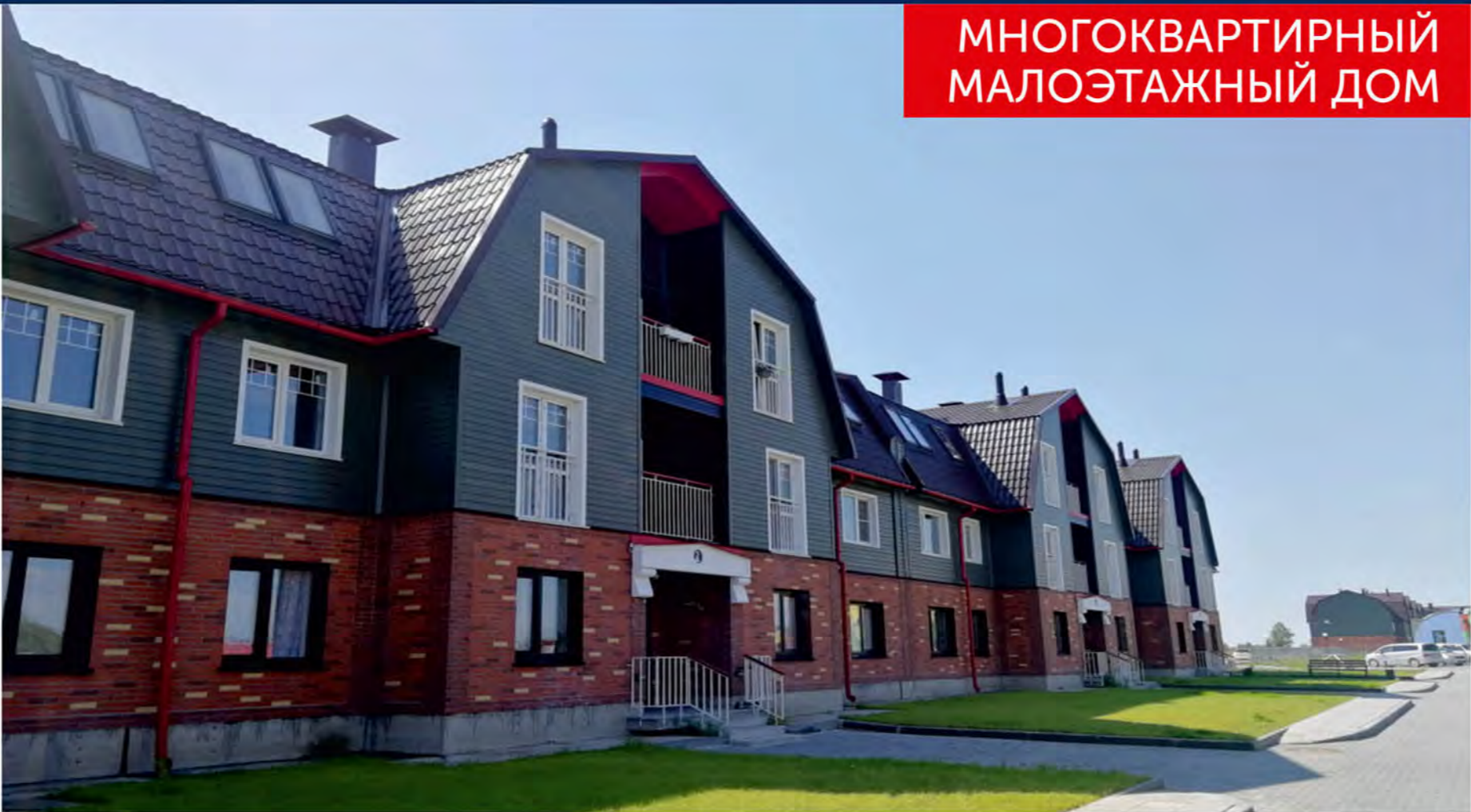
МНОГOKBAPТИРНЫЙ МАЛОЭТАЖНЫЙ ДОМ