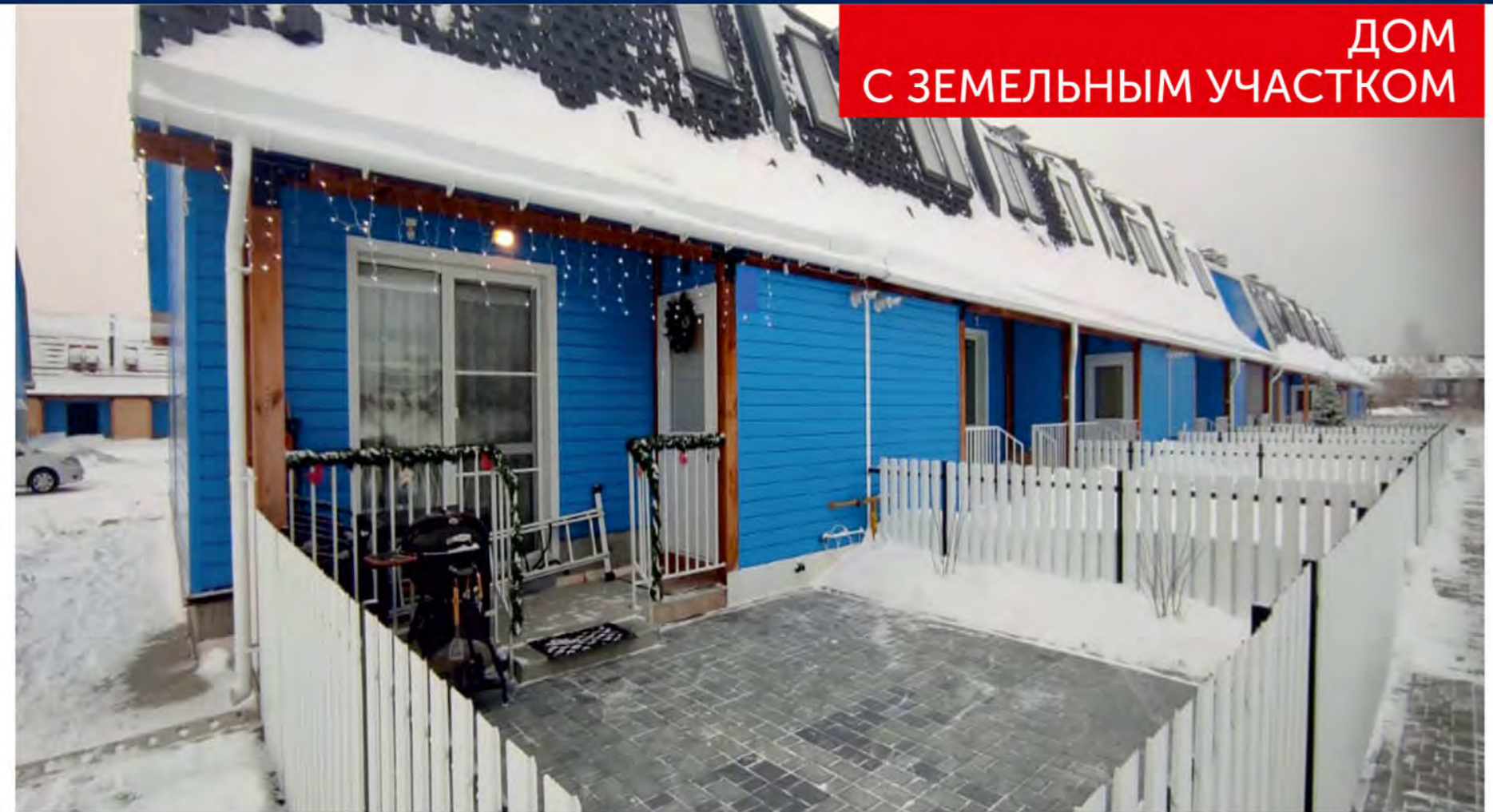
ДОМ С ЗЕМЕЛЬНЫМ УЧАСТКОМ