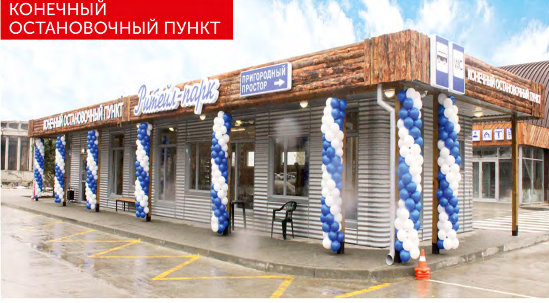
КОНЕЧНЫЙ ОСТАНОВОЧНЫЙ ПУНКТ