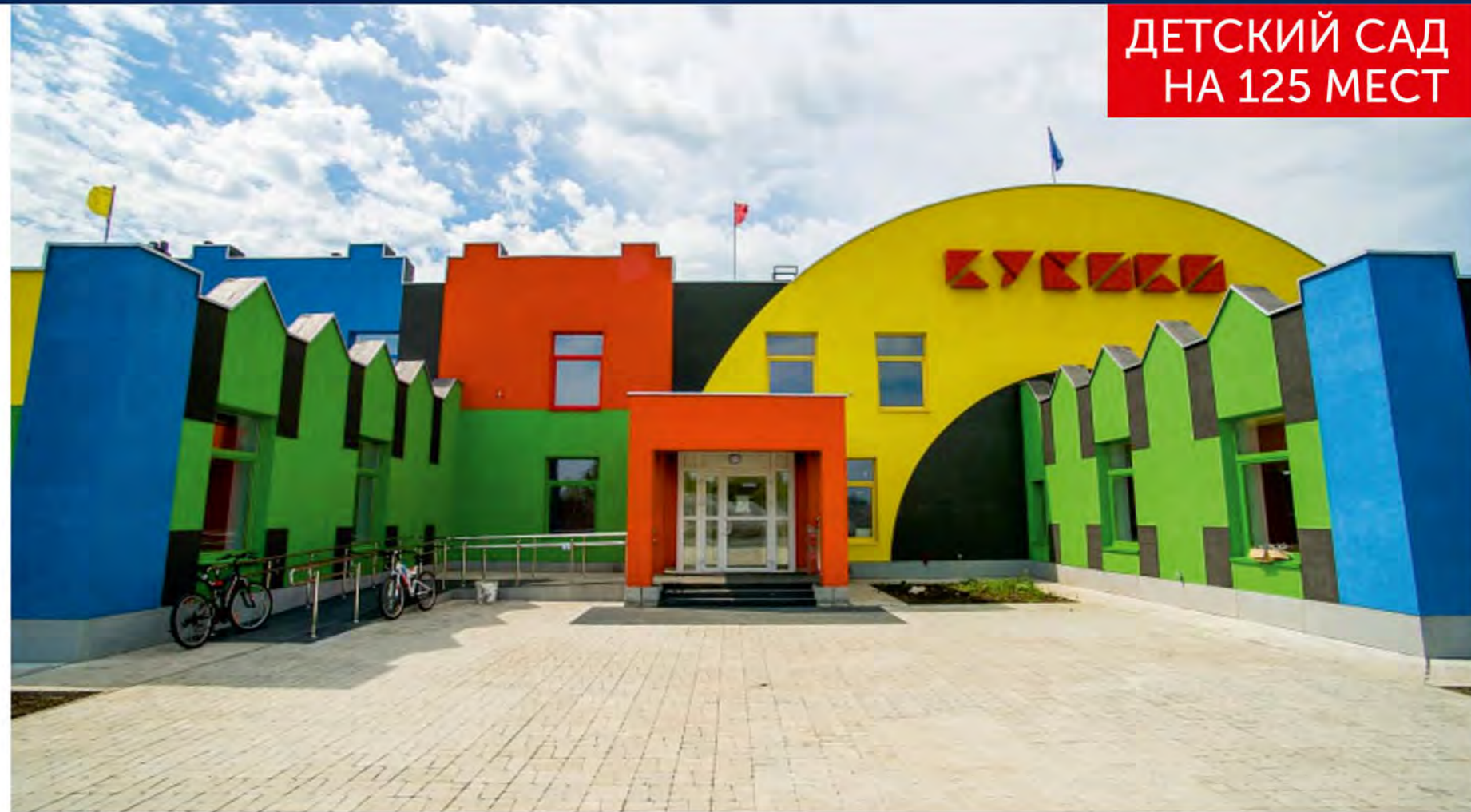
ДЕТСКИЙ САД НА 125 МЕСТ