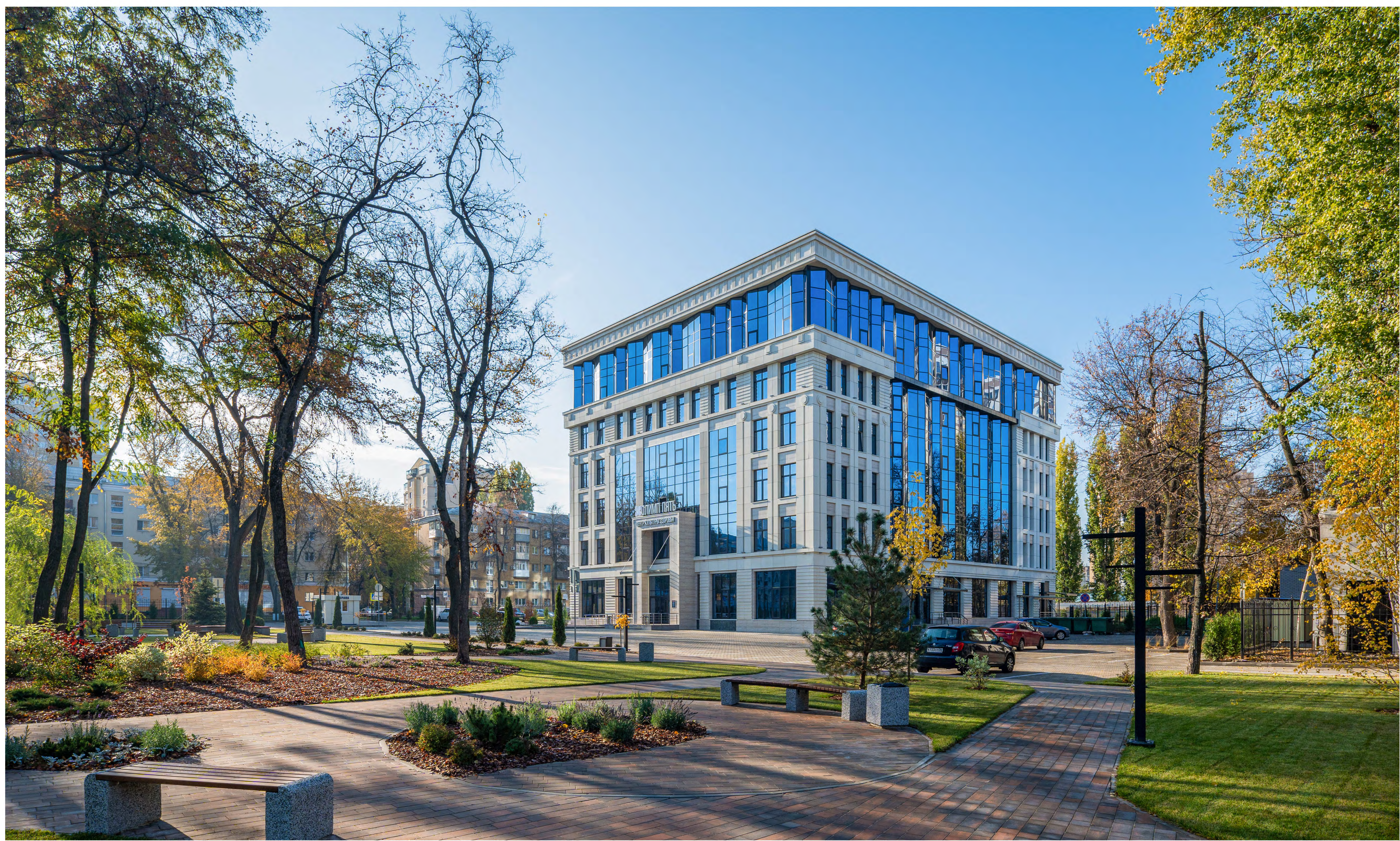
ОБЪЕКТ ЗДРАВООХРАНЕНИЯ (РЕАБИЛИТАЦИОННЫЙ ЦЕНТР), РАСПОЛОЖЕННЫЙ ПО АДРЕСУ: Г. ВОРОНЕЖ, УЛ. МОИСЕЕВА, 2/2