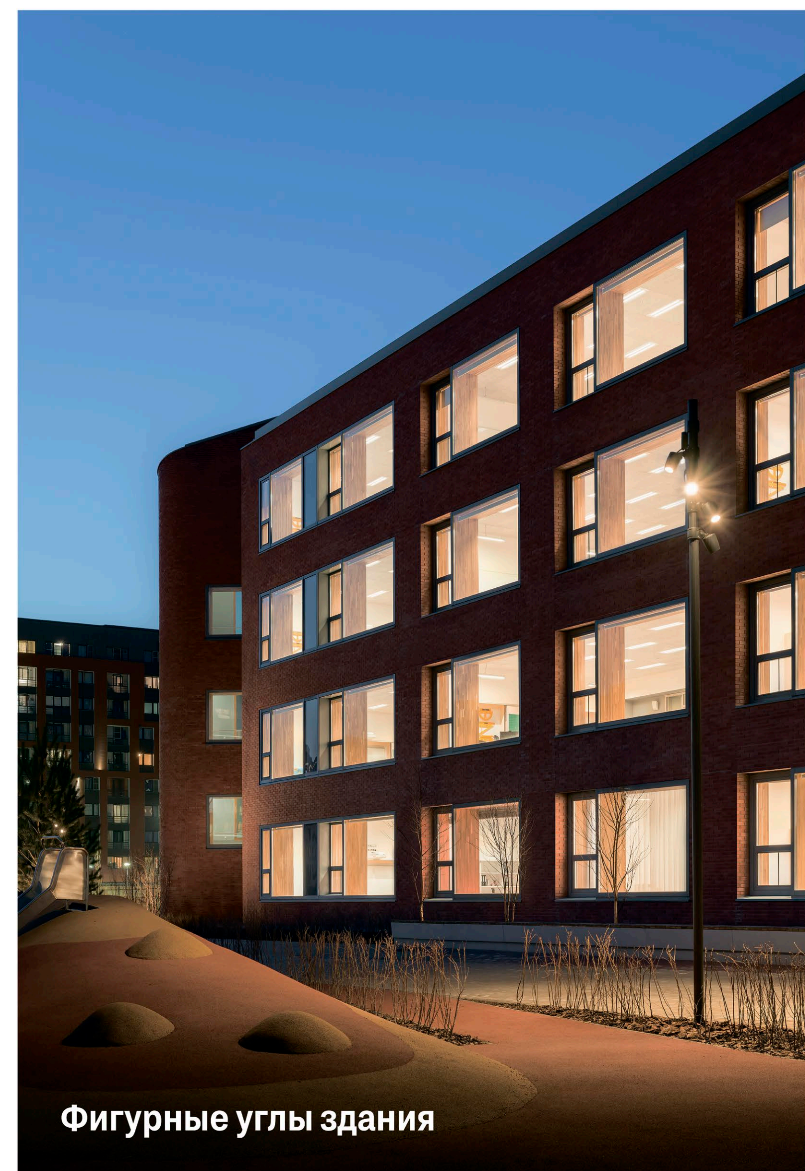
Фигурные углы здания