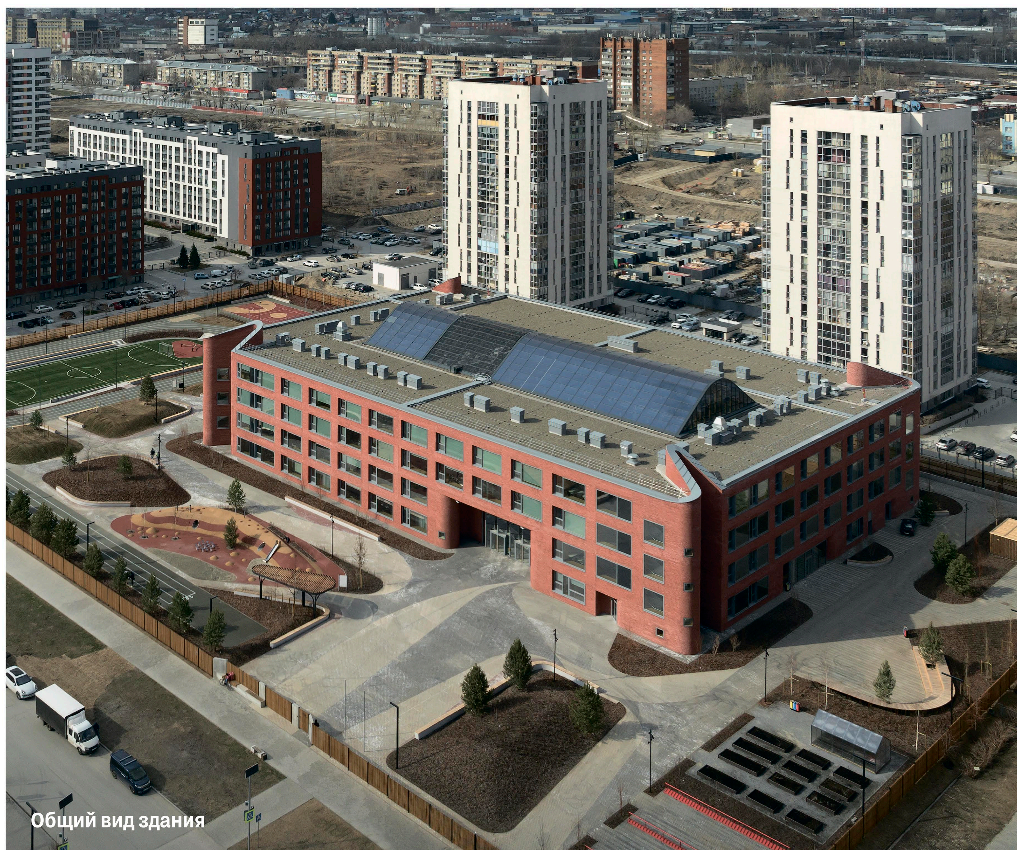
Общий вид здания

Команда проекта отказалась от привычных для советского градостроения n- или p-образного плана школьного здания и предложила для него новую компактную форму с минимальной площадью внешних фасадов и необычно устроенной планировкой без деления на тематические классы и чёткого распределения пространств. Получилась школа, легко приспосабливающаяся к любым изменениям.