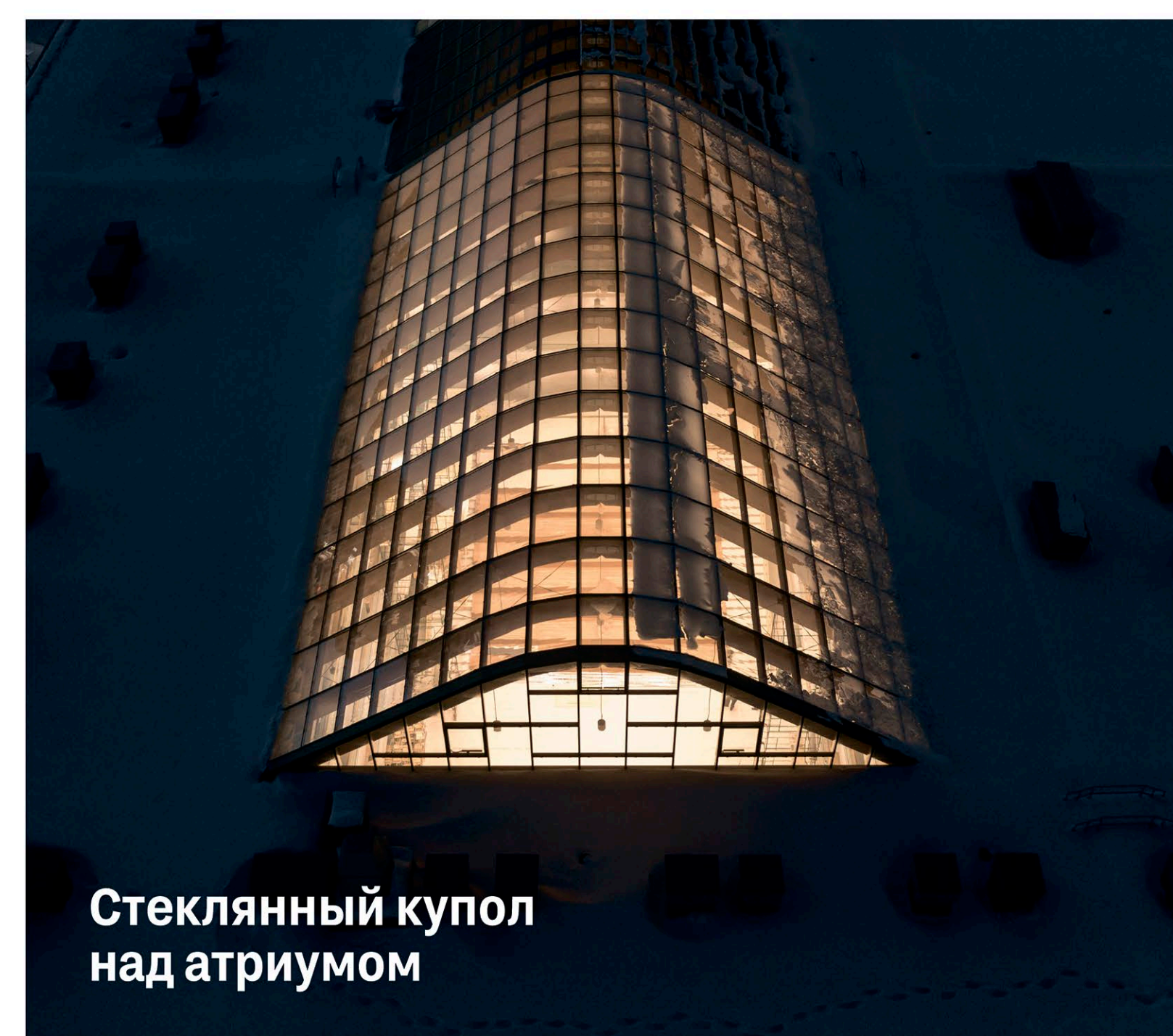
Стеклянный купол над атриумом