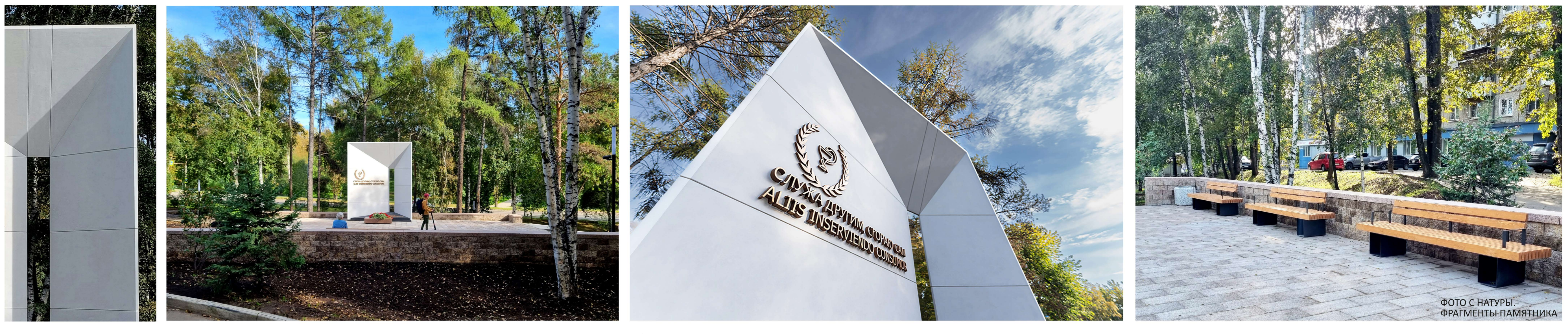
ФОТО С НАТУРЫ. ФРАГМЕНТЫ ПАМЯТНИКА