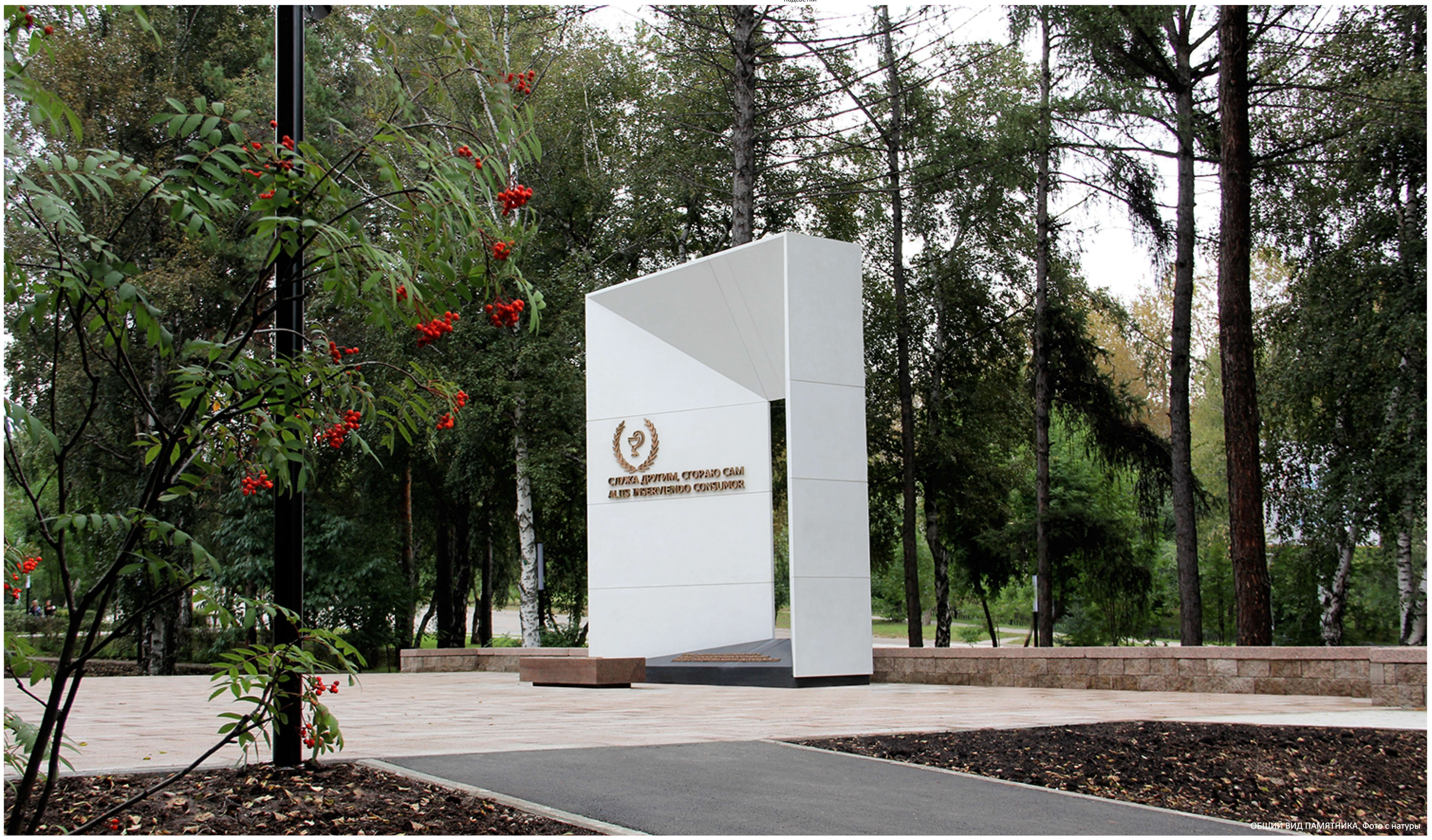
ОБЩИЙ ВИД ПАМЯТНИКА. Фото с натуры