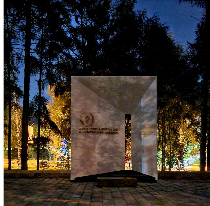
ОБЩИЙ ВИД в вечернее время. Фото с натуры