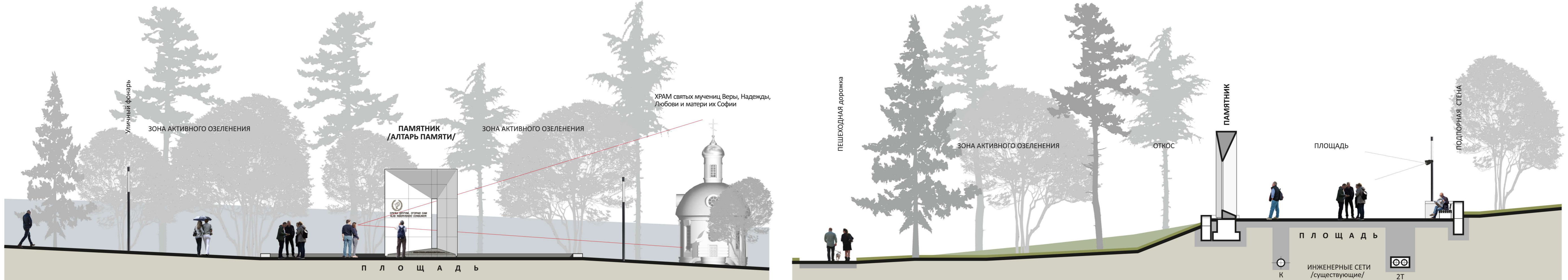
РАЗВЕРТКА со стороны ПЛОЩАДИ