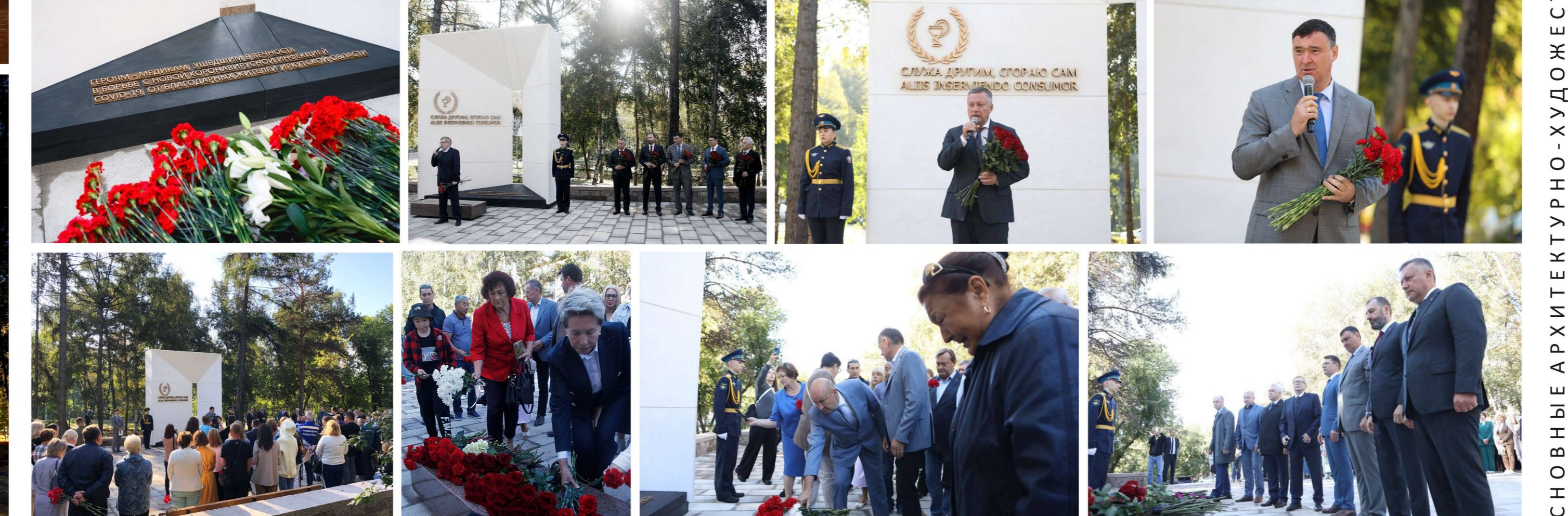
ФОТО С ОТКРЫТИЯ ПАМЯТНИКА. 4 сентября 2023 г.