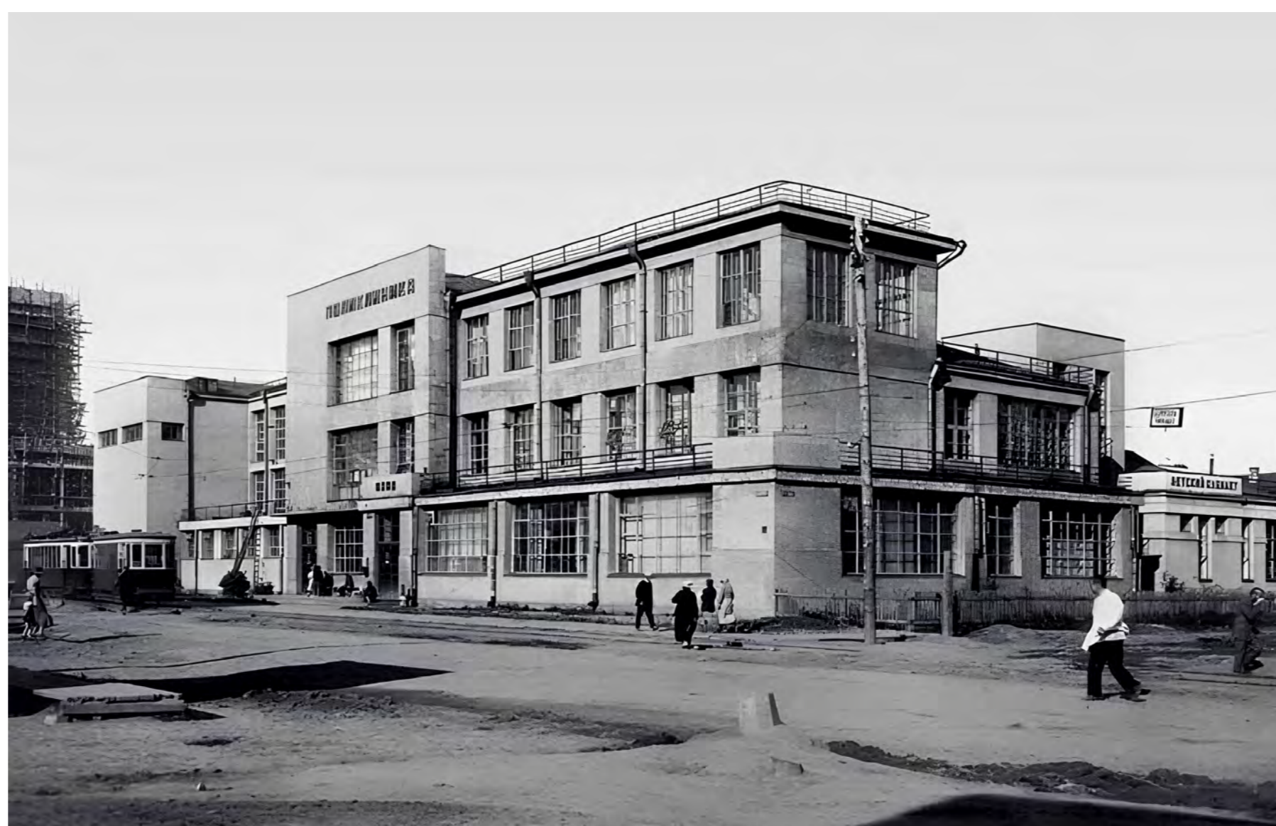
Здание поликлиники (30-е гг)

Заявленная тема проекта – острый диалог между хранителями уникального архитектурного наследия и новым поколением творческих новосибирцев, активно реагирующих и влияющих на городскую среду. По сути, это нужный нашему городу диалог художников и архитекторов, историков и преобразователей. Работы детей 11-13 лет – это манифесты эпохе конструктивизма, вдохновленные глубокими переменами во всех сферах жизни и талантом первопроходцев этой эпохи.