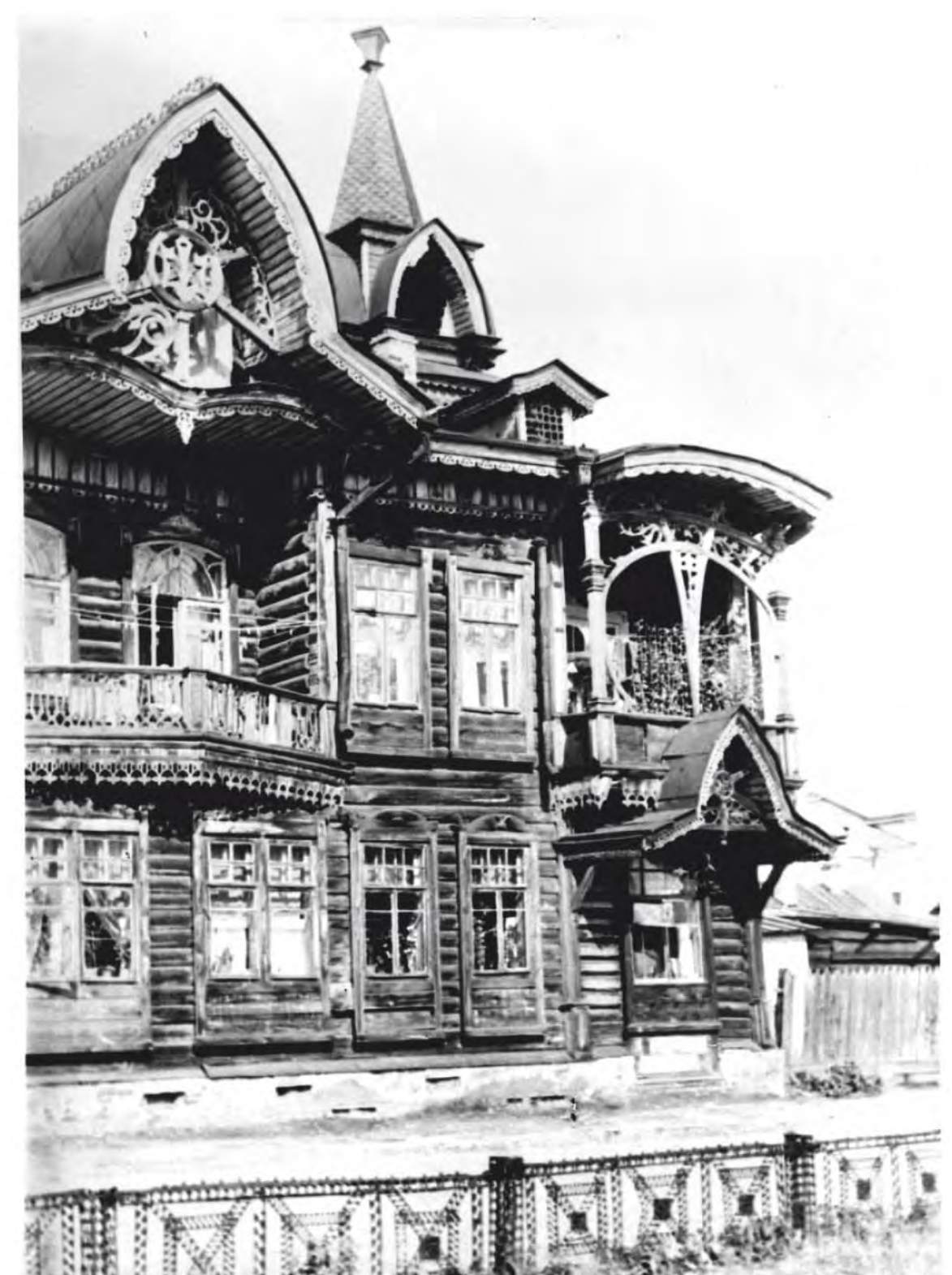
Фото 60-х годов 20 в.