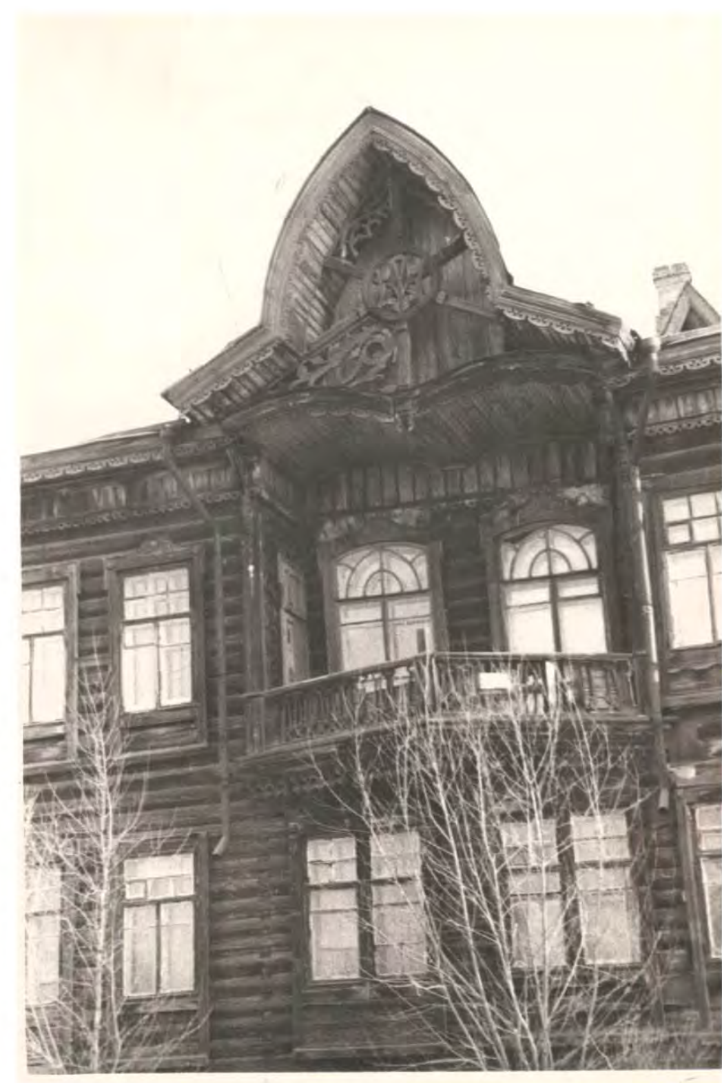
Фото 70-х годов 20 в.