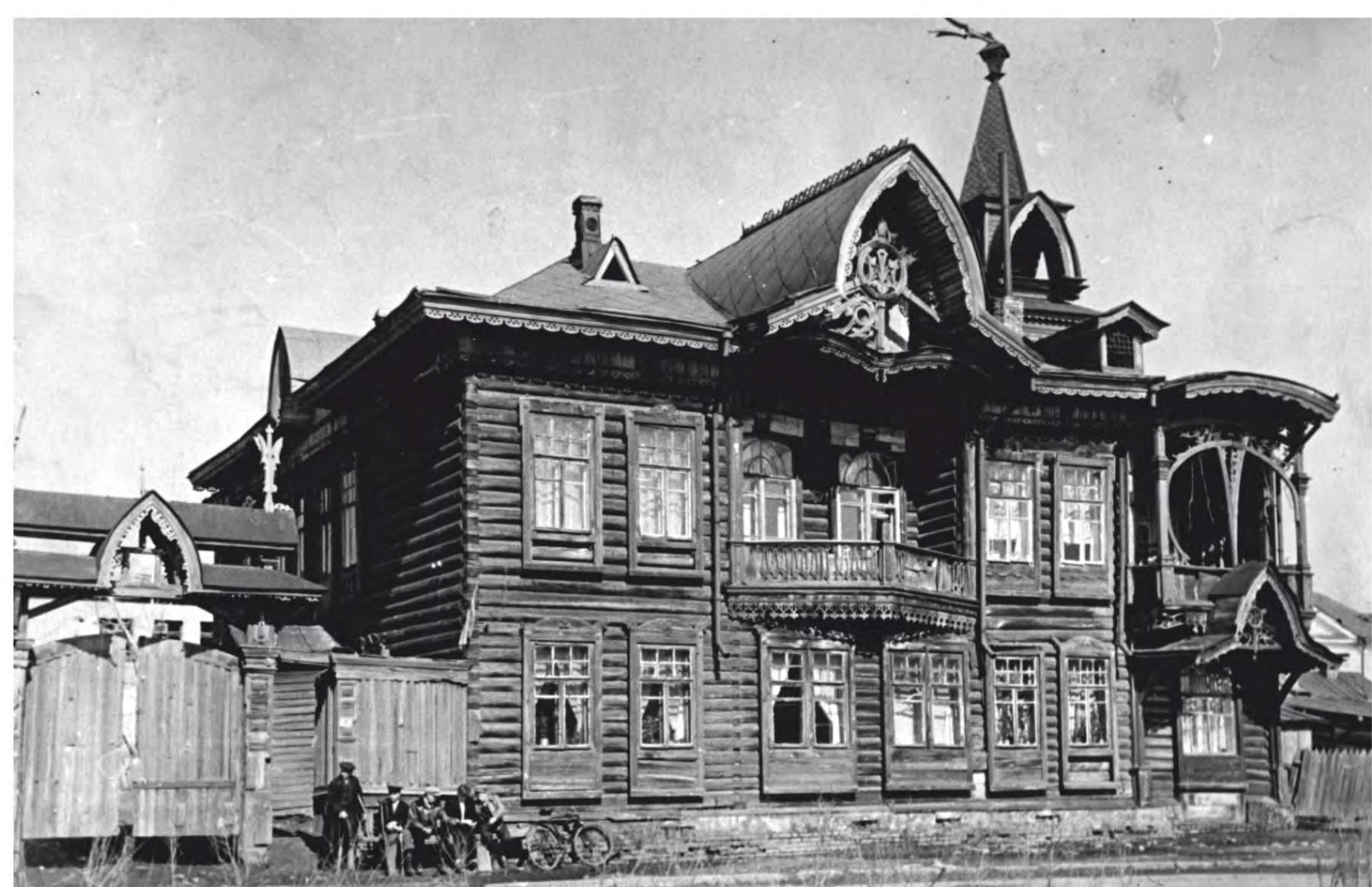
Фото 50-х годов 20 в.